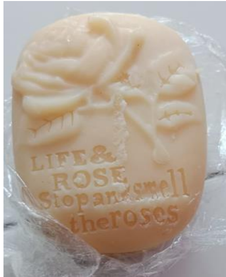
Gambar 4 Produk Sabun Mijel yang Siap Dijual