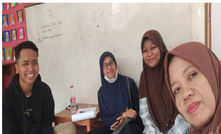
Gambar 3 Edukasi Strategi Marketing Bersama Ketua Unit Bank Sampah

Selanjutnya penulis melakukan edukasi kepada ibu-ibu pembuat sabun mijel khususnya kepada ketua pengelola unit Bank Sampah terkait pemanfaatan e-commerce dalam strategi pemasaran produk sabun mijel.