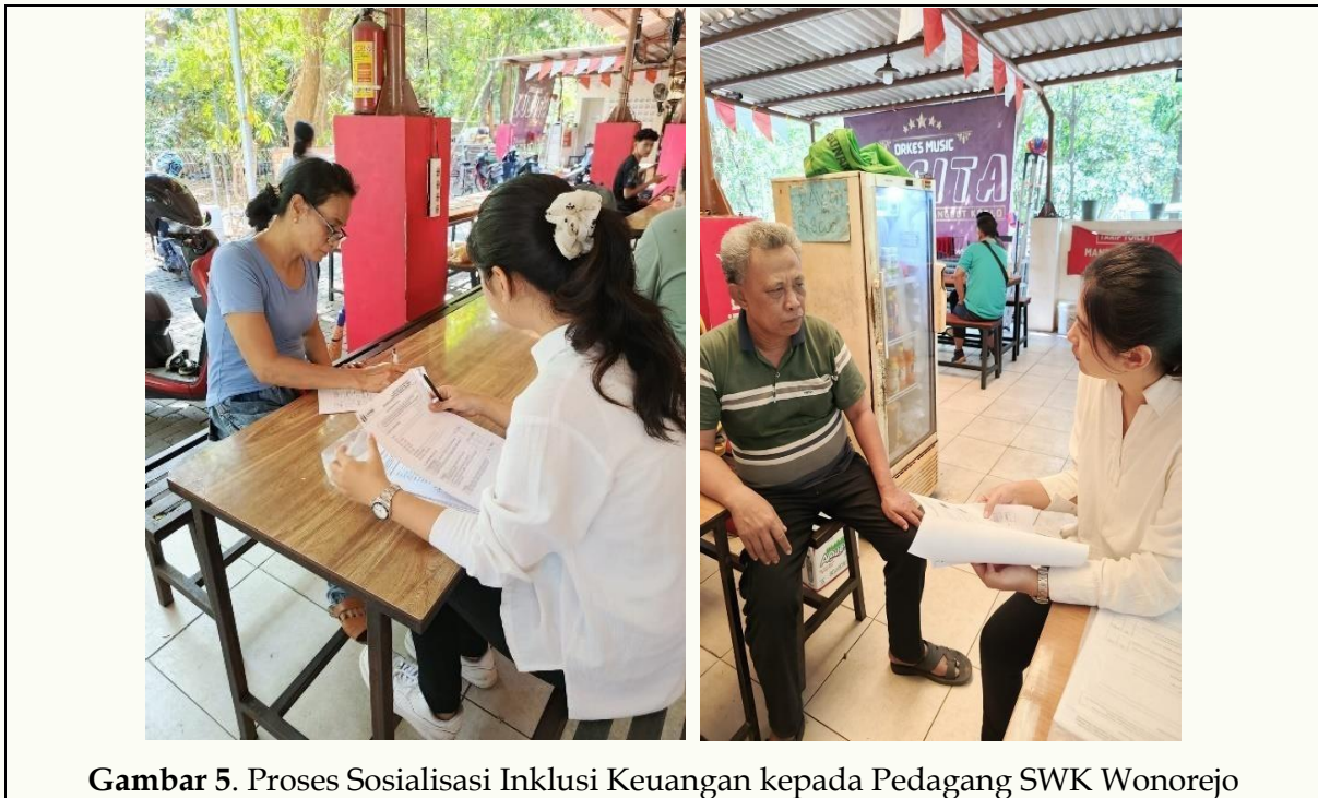
Gambar 5. Proses Sosialisasi Inklusi Keuangan kepada Pedagang SWK Wonorejo

Terkait dengan aspek manfaat penggunaan produk dan jasa dari lembaga keuangan perbankan, hasil wawancara serta pretest dan posttest menunjukkan bahwa kemudahan akses keuangan dan faktor rasa aman menjadi alasan utama yang mendukung penggunaan fasilitas produk dan jasa perbankan. Kebutuhan akan metode pembayaran yang banyak digunakan pengunjung juga mendorong pedagang memasang alat pembayaran digital seperti QRIS. Fasilitas ini memudahkan pedagang memantau pendapatan, menjamin keamanan dana, serta mengurangi risiko kesalahan pembayaran maupun penerimaan uang palsu. Penerapan alat pembayaran digital ini juga mengharuskan pedagang membuka rekening bank yang terintegrasi dengan aplikasi pembayaran, sehingga transaksi menjadi lebih efisien, aman, dan transparan. Kondisi ini konsisten dengan Yi (2023) yang menekankan bahwa strategi pemasaran bank dalam era digital finance berfokus pada pengembangan produk dan layanan yang mudah diakses untuk memperluas jangkauan nasabah. Dengan demikian, pedagang di lingkungan SWK memahami bahwa inklusi keuangan tidak hanya mempercepat transaksi, tetapi juga meningkatkan kenyamanan dan efisiensi usaha mereka. Sejalan dengan pengabdian masyarakat yang dilakukan oleh Silalahi et al. (2025), program edukasi yang praktis dan kontekstual terbukti efektif dalam meningkatkan pengelolaan keuangan, perencanaan bisnis, dan pengembangan produk pada segmen UMKM.