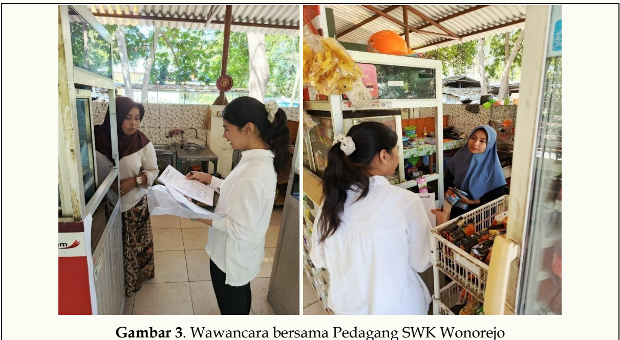
Gambar 3. Wawancara bersama Pedagang SWK Wonorejo

Temuan ini sejalan dengan studi global yang menunjukkan bahwa digitalisasi keuangan memperluas akses layanan UMKM, namun di Indonesia hasil serupa juga tercermin dalam penelitian Johadi, Widyantara, dan Waluyo (2023) yang menegaskan bahwa literasi keuangan memiliki pengaruh signifikan terhadap aktivitas UMKM di Kota Surakarta, terutama dalam meningkatkan ketahanan usaha melalui pemahaman pengelolaan keuangan.