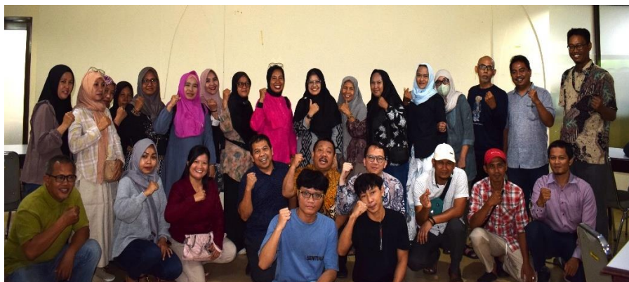
Gambar 6. Pemateri dan Para Pelaku usaha