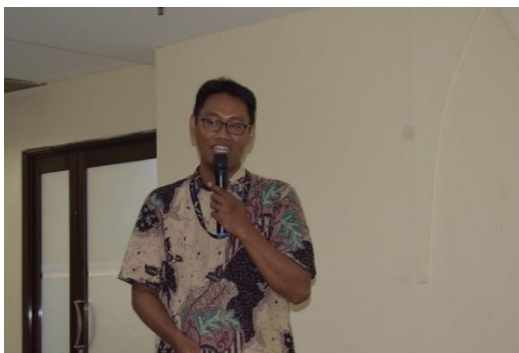
Gambar 5. Pemateri Ketiga terkait Mendapatkan Sertifikat Halal bagi Pelaku Usaha