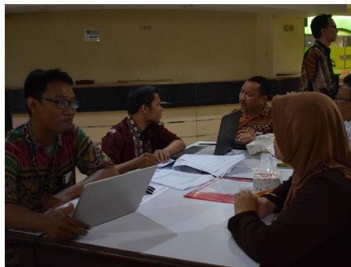
Gambar 8. Pendampingan Alur Proses Sertifikasi Halal Part 1