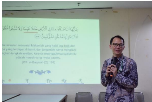
Gambar 3. Pemateri Pertama terkait Halal dan Thayyib dari Pendekatan Islam