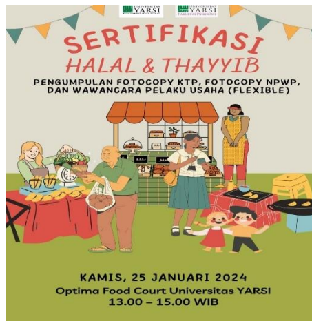
Gambar 7. Flyer Pengmas Halal dan Thayyib Flyer di hari kedua

Pertemuan kedua dilakukan pada hari kamis, 25 Januari 2024 dengan melakukan pendampingan alur proses sertifikasi halal, sehingga diharapkan pelaku usaha mendaftar dan mendapatkan sertifikat halal. Dari 31 peserta yang mengikuti program sosialisasi halal dan thayyib di hari pertama, 15 peserta yang tertarik untuk mendaftarkan usaha mereka ke sertifikat halal, 13 diantaranya sudah memiliki NIK, 12 sudah memiliki email, dan 6 sudah memiliki NIB, serta 1 pelaku usaha yang serius untuk melakukan “Pelatihan penyelia halal untuk pelaku usaha regular”.