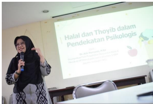
Gambar 4. Pemateri Kedua terkait Halal dan Thayyib dari Pendekatan Psikologis