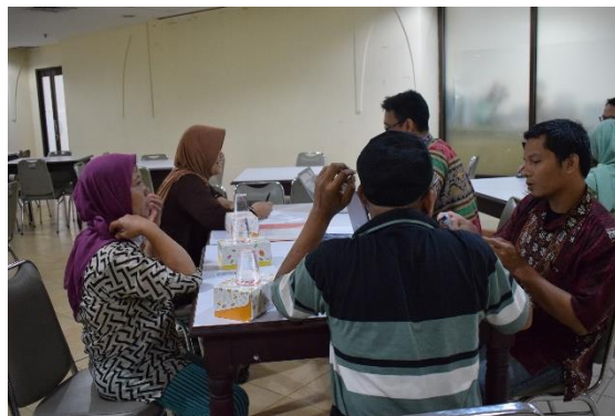
Gambar 9. Pendampingan Alur Proses Sertifikasi Halal Part 2