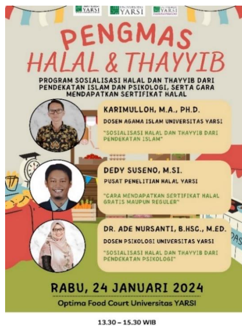
Gambar 1. Flyer Pengmas Halal dan Thayyib di hari pertama

Setelah ketiga pemaparan materi diberikan, tim pelaksana memberikan post-test dalam rangka mengukur pengetahuan partisipan terkait materi yang disampaikan. Apakah terdapat peningkatan pengetahuan peserta, khususnya mengenai produk halal dan thayyib? Selain itu, evaluasi pelaksanaan kegiatan juga dilakukan dengan meminta umpan balik dari peserta mengenai manfaat materi yang dipresentasikan, efektivitas metode penyampaian yang digunakan, serta sarana prasarana selama sosialisasi.