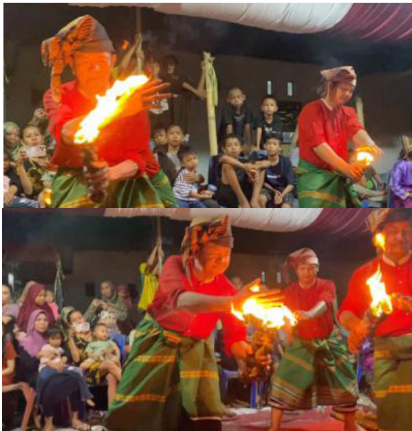
Gambar 2. Nyala api pada ju'ju berwarna kuning