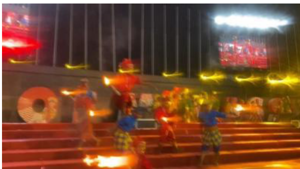
Gambar 5. Gawai penulis terkena bulir kecil minyak tanah saat atraksi annyapporo'

melakukan atraksi annyapporo' , dengan alasan keamanan penonton. Salah satu risiko yang perlu diantisipasi adalah bulir kecil minyak tanah yang tidak terbakar sempurna pada saat menyembur, sehingga ada kemungkinan bulir kecil tersebut mengenai penonton jika jarak terlalu dekat. Oleh karenanya, menjaga jarak yang aman antara penari dan penonton sangat penting untuk meminimalisir risiko.