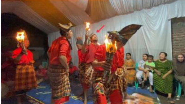
Gambar 4. Salah satu penari memerhatikan situasi sebelum atraksi