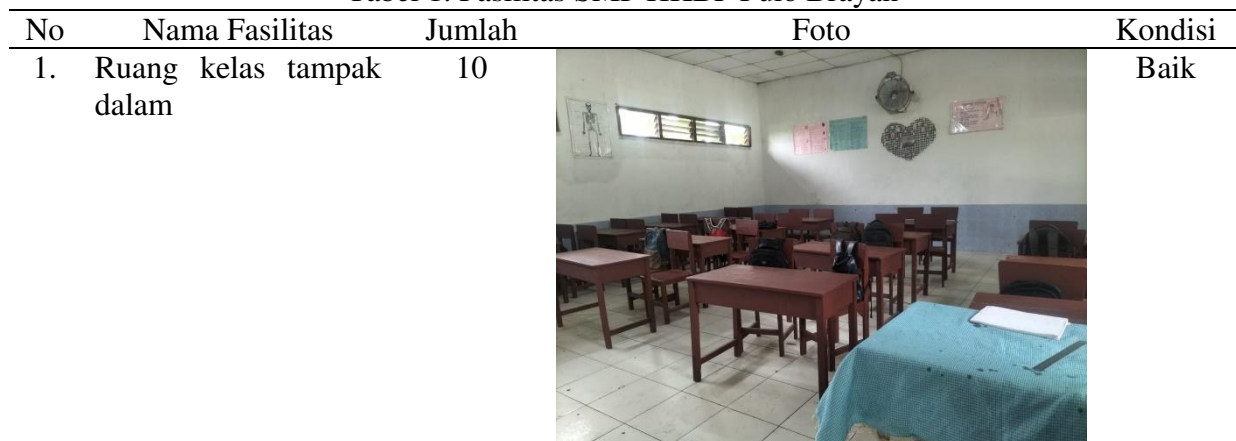
Tabel 1. Fasilitas SMP HKBP Pulo Brayan

Mitra dalam kegiatan ini SMP HKBP Pulo Brayan. Sekolah ini didirikan pada tahun 1972. Pada saat ini, SMP HKBP Pulo Brayan memiliki siswa sebanyak 120 orang dan jumlah guru yang mengajar sebanyak 10 orang. Banyak prestasi yang sudah diraih oleh siswa SMP HKBP Pulo Brayan, seperti Juara 2 lomba vocal solo tingkat regional Kota Medan pada tahun 2023, dan Juara 3 vocal grup gereja tingkat kecamatan tahun 2023. Prestasi ini masih berupa prestasi non akademik. Untuk itu, perlu ditingkatkan prestasi-prestasi siswa pada bidang akademik. Selain itu, pihak sekolah memiliki program unggulan seperti pembinaan sikap spritual melalui kegiatan kerohanian. Program ini berguna untuk meningkatkan mental dan kemampuan diri para siswa. Berdasarkan hasil survey, fasilitas yang telah dimiliki oleh pihak sekolah masih minim seperti ruang belajar siswa, meja belajar siswa, kursi belajar siswa, dan ruang perpustakaan. Foto fasilitas yang ada dapat dilihat pada Tabel 1.