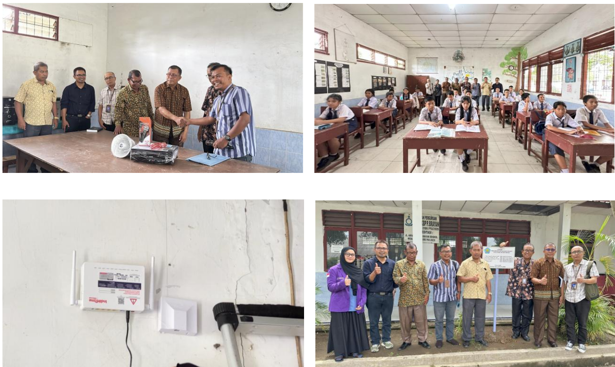
Gambar 2. Foto kegiatan

Pelaksanaan kegiatan dapat dilihat pada Gambar 2.