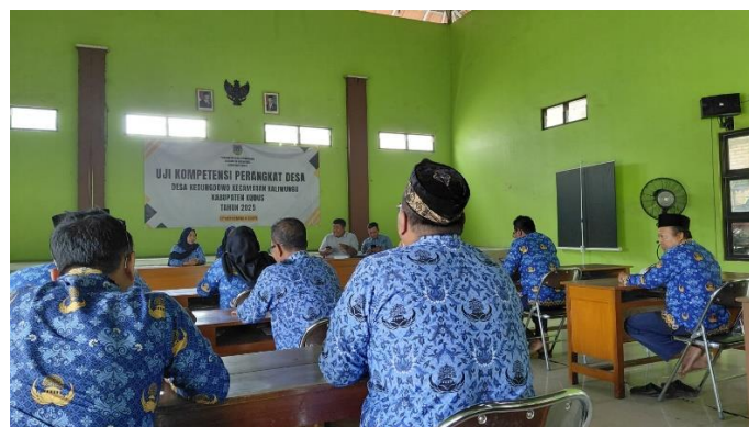
Gambar 1. Proses Pelaksanaan Asesmen

Tahapan pertama dalam kegiatan ini adalah pelaksanaan tes kepribadian menggunakan instrumen EPPS. Hasil analisis menunjukkan bahwa sebagian besar peserta memiliki kecenderungan kepribadian pada aspek autonomy dan exhibition . Aspek autonomy menunjukkan kecenderungan individu untuk bekerja secara mandiri dan mampu mengambil keputusan tanpa ketergantungan tinggi pada orang lain. Sementara itu, aspek exhibition menunjukkan kecenderungan individu untuk tampil aktif dalam komunikasi dan interaksi sosial.