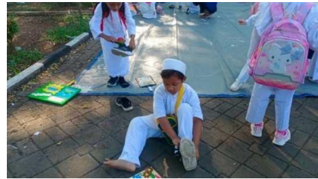
Gambar 8. Anak melepas dan memasang sepatu sendiri

“Dengan memberikan contoh dan dipraktikkan langsung terus menerus oleh anak, nanti akan bisa memakai sepatunya sendiri.” (CWG08)