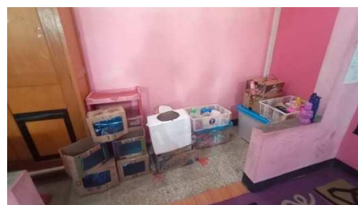
Gambar 26. Guru membuat media/alat untuk pembelajaran anak

“Iya pasti, guru-guru disini buat media/APE nya sentra masing-masing dan sekolah juga kasih kebebasan untuk berkreasi mau pakai bahan apa yang akan digunakan itu terserah mereka. Malah kadang ada yang udah dari jauh-jauh hari mau beli apa kayak gitu nyiapin bahan-bahan yang mau dipakai.” (CWG25)