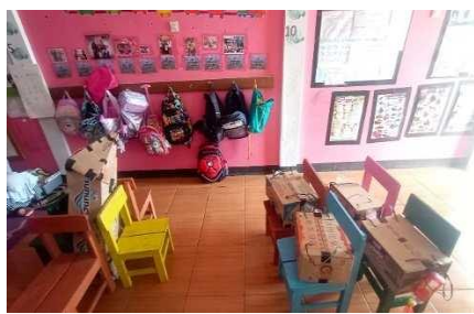
Gambar 22. Guru menyusun berbagai strategi dalam pembelajaran

“Kalo strategi lebih ke metodenya. Kalo model sentra, salah satu strateginya adalah pijakan. Kayak pijakan lingkungan main, pijakan sebelum main, pijakan saat main, dan pijakan setelah main. Misalnya untuk pijakan lingkungan main, guru harus pandai-pandai menata alat main dan menyesuaikan dengan ruangan yang ada” (CWG23)