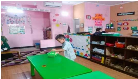
Gambar 2. Anak melakukan sesuatu atas dasar kemauannya sendiri

“Dengan menawarkan berbagai jenis kegiatan, nah kegiatan mana dulu yang anak sukai.” (CWG 02)