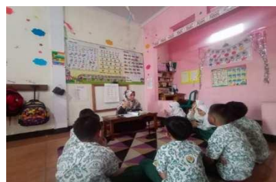
Gambar 20. Guru memahami karakter setiap anak

“Ya karna kita ketemu anak tiap hari, jadi kita guru-guru juga memahami dan mempelajari karakter anak setiap hari. Disini kita ada yang namanya masa ta'aruf ya atau perkenalan yang paling itukan 3 minggu pertama ya, 3 minggu pertama itu betul-betul membangun bonding dengan anak iya mempelajari karakter anak iya gitu. Dan biasanya dimasa ta'aruf ada kegiatan dimana anak-anak diajarkan untuk melakukan aktivitas mandiri.” (CWG21)