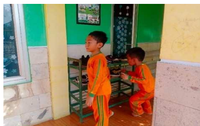
Gambar 21. Guru mampu dan keterampilan dalam mengoptimalkan kemandirian anak

Seorang guru harus mampu dan terampil dalam menyusun berbagai strategi dalam pembelajaran, dengan begitu guru dapat menciptakan pembelajaran yang lebih efektif agar anak tertarik untuk mengikuti kegiatan belajar. Strategi pembelajaran yang digunakan oleh guru kelas B8 RA Al-Izzah yaitu pijakan pada model pembelajaran sentra. Hal ini dapat dilihat dari hasil catatan dokumentasi kemudian didukung oleh hasil wawancara dengan guru kelas sebagai berikut: