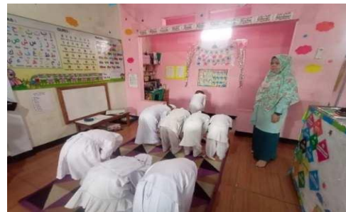
Gambar 14. Anak mampu praktek shalat sendiri

“Dengan terbiasa sholat berjamaah anak anak mampu praktek shalat sendiri.” (CWG14)