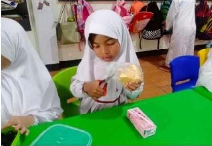
Gambar 11. Anak makan dan minum sendiri

“Dengan memberikan contoh dan anak mengulanginya lagi untuk membuka makanannya sendiri.” (CWG11)