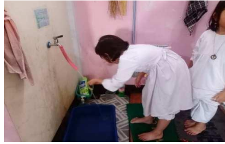
Gambar 13. Anak mengambil wudhu sendiri

“Dengan mempraktekkan wudhu dan menempelkan poster tata cara wudhu di atas keran air wudhu.” (CWG13)