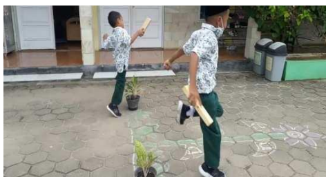
Gambar 24. Guru memadukan pembelajaran kemandirian dengan aktivitas belajar anak baik saat dalam di dalam kelas maupun di luar kelas

Guru mampu memberikan contoh yang konkrit dalam segala hal yang diajarkan. Guru mengajarkan anak satu hal yang lebih real dalam kehidupan sehari-hari seperti saat anak-anak makan. Anak-anak diajarkan untuk membuka jajanannya sendiri. Guru menyiapkan gunting di setiap meja yang sebelumnya guru menjelaskan bahwa itu adalah benda tajam dan memakainya harus hati-hati. Guru memberi penjelasan kepada anak bagaimana cara menggunakan dan cara memberikan benda tersebut pada temannya agar mereka tidak terluka. Setelah guru mengenalkan benda tersebut, keesokan harinya guru menempatkan gunting di tempat yang seharusnya dimana anak mengambil sendiri tanpa disiapkan oleh guru. Guru menanamkan pada anak bahwasanya kita bukan hanya harus menjaga keselamatan diri sendiri tetapi keselamatan teman juga serta ada sopan santun jika ingin memberi sesuatu. Hal ini dapat dilihat dari hasil catatan dokumentasi yang didukung oleh hasil wawancara dengan guru kelas sebagai berikut: