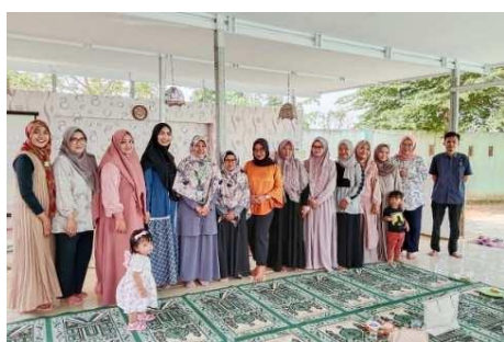
Gambar 30. Bentuk kerjasama antara guru dan orangtua

“Ya kadang suka berdiskusi ya, sama guru disini seperti apa gitu, ya pokoknya saling berkomunikasi aja deh sama guru terkait perkembangan anak. Kalau makan kan memang udah dari awal diajarkan sendiri ya, jadi yang dilakukan sudah dibiasakan juga di rumah.” (CWG29)