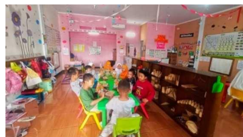
Gambar 10. Anak makan dan minum sendiri

“Dengan mencontohkan dan mempraktekkan makan bersama menggunakan tangan kanan dan duduk di kursi di saat makan dan minum.” (CWG10)