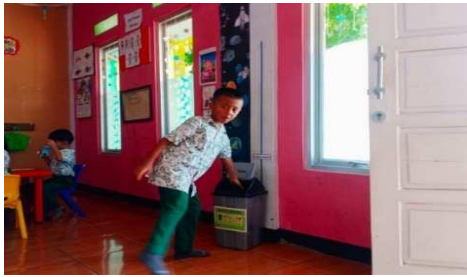
Gambar 16. Anak membuang sampah pada tempatnya

“Dengan mempraktekkan membuang sampah pada tempatnya dan sering membacakan hadist tentang kebersihan.” (CWG16)