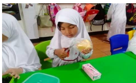
Gambar 25. Guru memberikan contoh yang konkrit dalam segala hal yang diajarkan

“Kalau saya sih ya ngajarin hal konkrit ke anak, ke arah yang lebih real dalam kehidupan sehari-hari seperti saat anak-anak lagi makan. Pas mereka mau buka makanannya pake guntingkan itu juga benda yang nyata jadi pertama saya ajarkan mereka cara memegang dan mengasih benda tersebut ke orang seperti apa agar tidak melukai orang lain.” (CWG25).