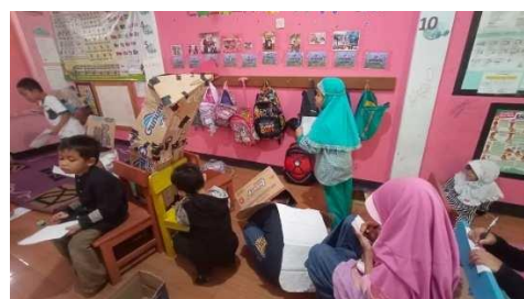
Gambar 23. Guru menciptakan suasana belajar yang aktif dan menyenangkan

“Sebelum mulai belajar, anak-anak memerlukan transisi antara rumah dan sekolah, yaitu jurnal. Transisi ini penting agar anak siap untuk mengikuti pembelajaran di sekolah. Selain itu guru harus menyediakan ragam main yang dapat memenuhi intensitas dan densitas bermain anak kayak misalnya pas KBM kita pakai sentra jadi anak bisa lebih aktif saat belajar. Bisa juga ngajak anak bercakap-cakap, demonstrasi, bercerita seperti itu” (CWG24)