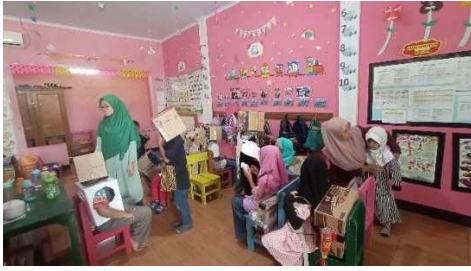
Gambar 1. Anak melakukan hal-hal baru

Anak mampu melakukan sesuatu atas dasar kemauannya sendiri, terlihat pada saat membersihkan bekas makanannya dan juga saat anak menutup pintu kelas. Hal ini dapat dilihat dari hasil catatan dokumentasi dan catatan wawancara guru sebagai berikut.