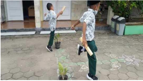
Gambar 27. Guru memanfaatkan sarana prasarana di sekolah

Guru mampu memotivasi anak. Dalam hal ini guru memberikan pujian kecil (contoh: hebat, good ) dan guru memberikan semangat pada anak untuk menyelesaikan tugasnya dengan tuntas. Hal ini dapat dilihat dari hasil catatan dokumentasi dan terdapat dimana guru memberikan reward berupa barang pada anak sebagai bentuk apresiasi telah mengikuti pembelajaran di semester 2, kemudian didukung oleh hasil wawancara dengan guru kelas sebagai berikut: