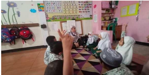
Gambar 6. Anak berani mengungkapkan pendapat

“Dengan sering diajak komunikasi dan distimulus untuk dapat mengungkapkan pendapat saat bercerita kembali serta diberikan tepuk tangan kepada anak yang sudah berani mengungkapkan pendapatnya.” (CWG06)