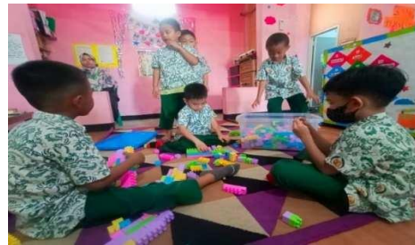
Gambar 18. Anak bermain leggo dan balok

“Dengan bermain bersama dan membacakan aturan untuk bermain, anak dapat bermain leggo dan balok dengan aman.” (CWG18)