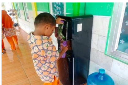
Gambar 17. Anak mengisi ulang air minumnya

“Dengan mempraktekkan cara mengisi ulang botol kepada anak dan anak jangan ragu untuk anak mempraktekkan sendiri mengisi ulang botol minumnya.” (CWG17)