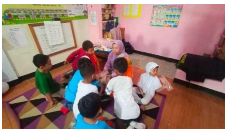
Gambar 28. Guru memotivasi anak

“Kayak biasanya saya kasih contoh temannya yang sudah mandiri lalu ngajak yang lain untuk melakukan hal yang sama (contoh: ayo kamu juga bisa, coba dulu yuk). Dan kalo saya yang paling penting itu kasih pujiannya tepat sama satu lagu tidak berlebihan. Jadi jangan sampe anak ngelakuin sesuatu karna ingin dipuji. Tadi pun saya kasih mereka kotak pensil untuk baru sekali itu loh sebelumnya saya ga pernah kasih karna ini juga sudah diakhir pembelajaran semester jadi ya gapapa lah sesekali saya kasih mereka.” (CWG26)