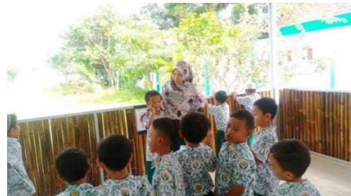
Gambar 5. Anak berani tampil di depan kelas

“Memotivasi anak, membacakan buku pilar karakter mandiri, dan memberikan tepuk tangan karena sudah berani maju di depan kelas.” (CWG05)