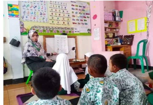
Gambar 29. Guru memecahkan masalah serta mencari solusi seputar pembelajaran

“Cuman tiap anak kan namanya dapet karakter yang berbeda-beda, cara menangannya pun berbeda. Kayak disini misalnya dari 10 anak ada 4 perempuan dan ada 6 laki-laki, cara menghadapinya berbeda. Jadi triknya itu tergantung kasusnya, tergantung kejadiannya”. (CWG27)