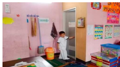
Gambar 15. Anak melakukan aktivitas ke toilet sendiri

“Dengan mengajarkan kepada anak jika ingin bab atau bak langsung ke kamar mandi, jika tidak bisa untuk membersihkannya sendiri nanti di ajarkan dulu dan dipraktekkan kepada anak.” (CWG15)