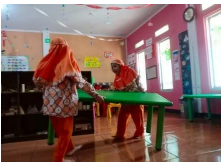
Gambar 12. Anak merapikan mainannya sendiri

“Dengan membacakan pilar karakter untuk bertanggung jawab dan memberikan tugas kepada anak untuk merapikan mainannya dulu sebelum bermain” (CWG12)