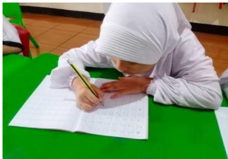
Gambar 7. Anak menyelesaikan tugasnya sendiri

“Dengan dimotivasi dan diberikan arahan untuk menyelesaikan tugas hingga tuntas.” (CWG07)