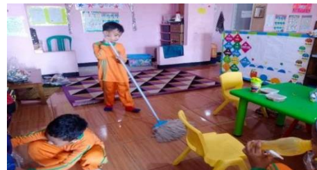
Gambar 19. Anak mengatasi masalah yang secara tidak sengaja dilakukan

“Dengan menyampaikan kepada anak untuk menyelesaikan masalah yang dihadapinya dan di berikan solusi agar tidak mengulanginya kembali” (CWG19)