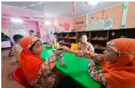
Gambar 3. Anak saling berbagi

“Dengan kita sering memberikan contoh untuk berbagi makanan atau dengan bercerita kalau berbagi makanan nanti kita akan dibalas Allah karena sudah mau berbagi makanan.” (CWG03)