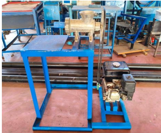
Gambar 3. Mesin Hasil Pembuatan