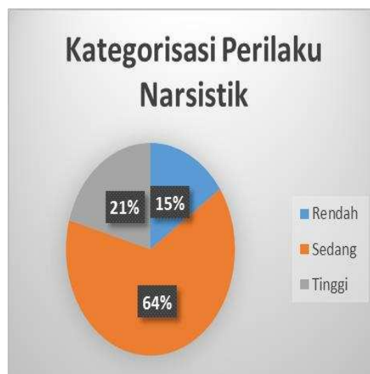
Gambar 1. Pie Chart Perilaku Narsistik Siswa Kelas XI SMA N 1 Srandakan.

Berdasarkan tabel tersebut dapat diketahui bahwa perilaku narsistik pada siswa kelas XI SMA Negeri 1 Srandakan sebagian besar berada pada kategori sedang.