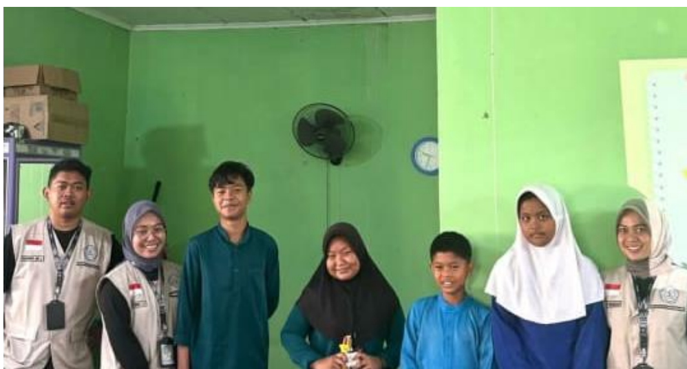
Gambar 3. Foto bersama siswa dan siswi yang berpartisipasi dalam pretest dan posttest

Peningkatan pengetahuan yang signifikan dari pretest ke posttest menunjukkan bahwa banyak siswa yang awalnya kurang memahami topik diare dapat mengadaptasi pengetahuan baru setelah diberikan informasi yang komprehensif. Diskusi langsung dan sesi tanya jawab memberikan kesempatan bagi siswa untuk mengeksplorasi pengetahuan mereka lebih dalam, serta mengoreksi kesalahan pemahaman yang ada sebelumnya.