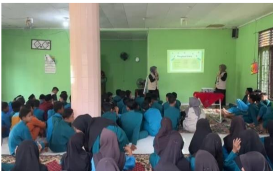
Gambar 2. Penyuluhan Swamedikasi Diare

Peningkatan ini menunjukkan efektivitas metode tanya jawab dalam meningkatkan pengetahuan siswa. Meskipun hanya beberapa siswa yang bisa menjawab dengan baik pada pretest , antusias dan keterlibatan mereka selama proses pembelajaran sangat terlihat, yang mungkin berkontribusi pada hasil positif di posttest .