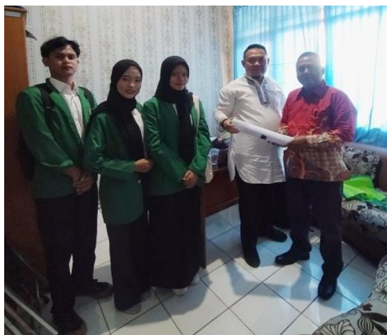
Gambar 2. Penjajakan Lokasi (Tim PKM diterima oleh Sekretaris Diknas Kota Bengkulu)

Pada kegiatan ini observasi dilakukan oleh tim pelaksana untuk mengetahui dan melihat secara langsung apa saja masalah sekaligus mengumpulkan data yang bisa diangkat untuk dijadikan sebagai video profile.