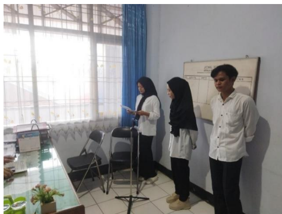
Gambar 3. Pengambilan Video Wawancara / Kepala Bidang

Pada tahap ini dilakukan dengan mengambil gambar/video dan juga wawancara kepala bidang yang ada pada Dinas Pendidikan dan Kebudayaan Kota Bengkulu.