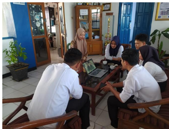
Gambar 3. Penyerahan Video Proker

Pada tahap ini dilakukan evaluasi Sebelum resmi dirilis, video tersebut akan dievaluasi oleh tim media Dinas Pendidikan dan Kebudayaan Kota Bengkulu. Setelah dievaluasi, video tersebut siap dipublikasikan sebagai alat yang efektif untuk mempromosikan layanan dan membangun hubungan positif dengan Masyarakat.