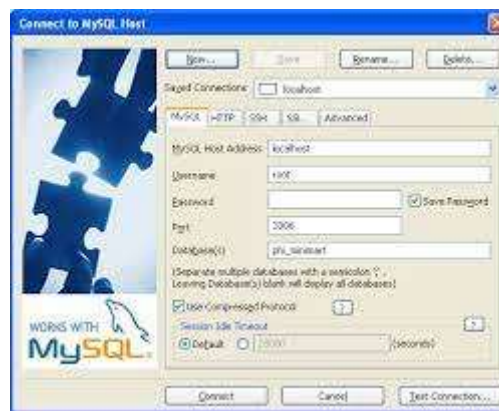
Gambar 1. SQLyog