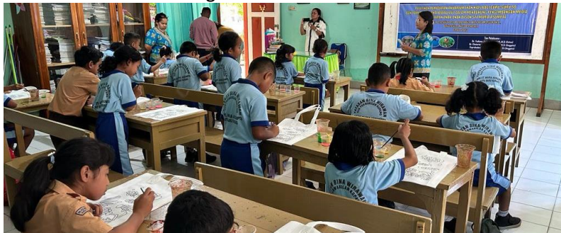
Gambar 4. Suasana Lomba Mewarnai Biota Laut Kategori Siswa Kelas II