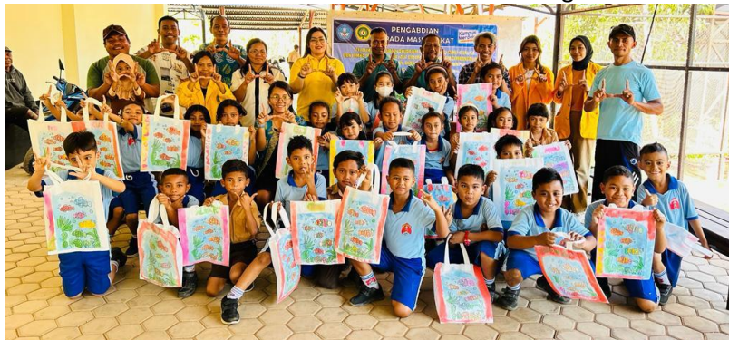
Gambar 5. Siswa Kelas II bersama Guru, perwakilan LPPM Undana, Tim Pelaksana dan Mahasiswa Memaparkan Hasil Karya Lomba Mewarnai Biota Laut