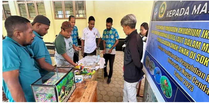
Gambar 2. Pelatihan Pembuatan Akuarium Hias bagi Guru-guru SDK STA Maria Assumpta