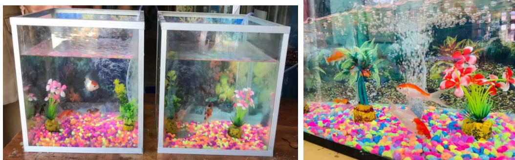
Gambar 3. Paket 2 (dua) Akuarium Hias yang merupakan Hasil dari Kegiatan Pelatihan