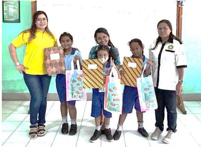
Gambar 6. Juara I, II, dan III Lomba Mewarnai Biota Laut Siswa Kelas II

Rangkaian kegiatan pengabdian kepada masyarakat (PkM) di SDK STA Maria Assumpta telah dipublikasi di media elektronik, kanal YouTube dan website Undana (Lampiran 2). Publikasi pada media elektronik pada laman Suluh Nusa, Undana, dan TTU iNews yang dapat diakses pada laman: https://suluhnusa.com/jurnal/20230918/sdk-maria-asumpta-gelar-pelatihan-pengembangan-media-pembelajaran-anak https://ttu.inews.id/read/346945/pkm-beri-pelatihan-membuat-akuarium-ikan-hias-bagi-guru-dan-lomba-mewarnai-biota-laut-bagi-siswa?utm_medium=sosmed&utm_source=whatsapp .