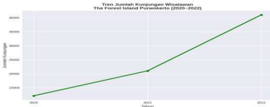
Gambar 1. Grafik Data Pengunjung The Forest Island Purwokerto tahun 2020-2022

Grafik diatas menunjukkan tren kunjungan wisatawan yang terus meningkat dari tahun ke tahun. Pada tahun 2020 jumlah kunjungan tercatat sebanyak 12.111 orang, kemudian naik signifikan pada tahun 2021 menjadi 21.021 orang. Peningkatan yang lebih tajam terjadi pada tahun 2022, dengan jumlah kunjungan mencapai 41.033 orang. Pola ini memperlihatkan adanya pertumbuhan eksponensial, di mana laju kenaikan semakin besar setiap tahunnya, dengan rata-rata peningkatan kunjungan mencapai lebih dari 70% per tahun. . Pertumbuhan ini menunjukkan bahwa The Forest Island semakin dikenal luas, baik melalui promosi maupun rekomendasi wisatawan. Selain itu, peningkatan fasilitas dan daya tarik wisata turut menjadikan destinasi ini semakin kompetitif di kawasan Purwokerto.