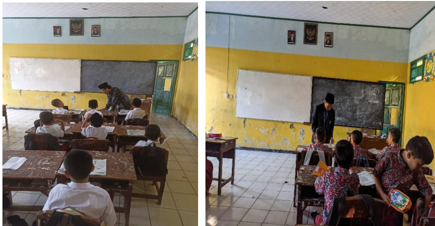
Gambar.Observasi di sekolah

Tahap pertama yang dilakukan ialah persiapan dengan melakukan observasi dan melihat situasi di sekolah