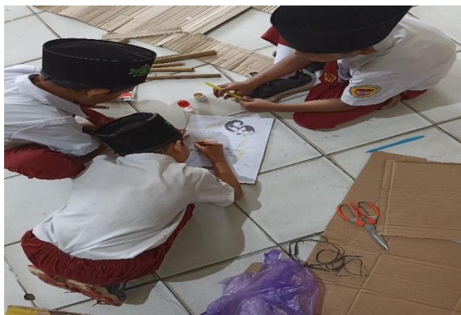
Gambar. Peserta didik mewarnai gambar wayang

Pada tahap pelaksanaan kami membawa gambar wayang yang tertera di atas, lalu para peserta didik mewarnainya dengan tujuan untuk melatih kecerdasan art pada anak dan melatih motorik anak.