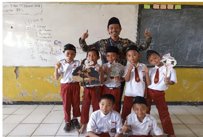
Gambar. Hasil pembuatan wayang berbahan kardus

terpotong selanjutnya memasangkan gapit wayang yang terbuat dari bambu yang telah disiapkan dan tahap terakhir memasangkan kengan-lengan wayang yang terpotong, selesai dan jadilah wayang kardus.