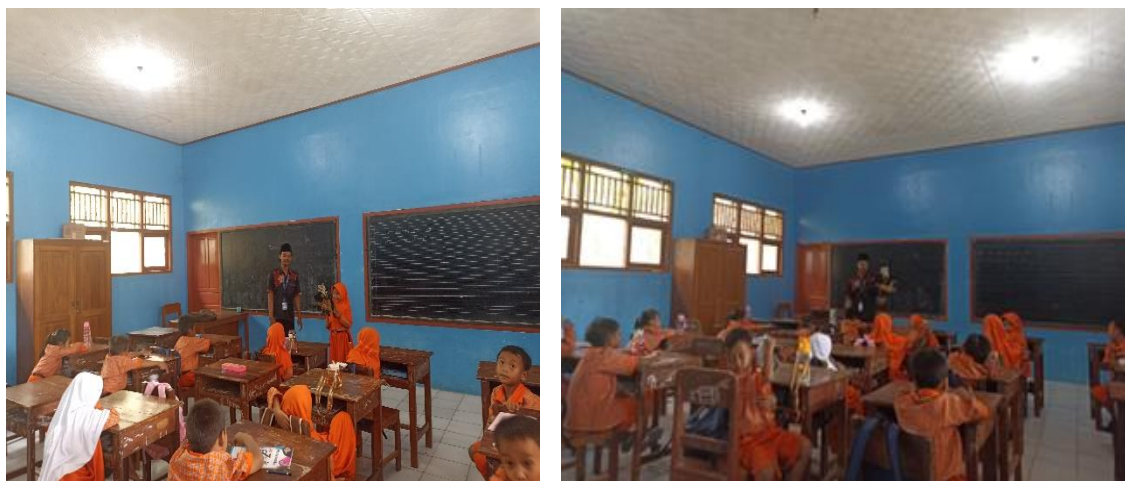
Gambar. Meceritakan, mengenalkan tokoh wayang pada peserta didik

Pada sesi pengenalan, ialah kami mengenalkan tokoh Semar diantaranya karakter dan falsafahnya beserta pitutur-pituturnya di setiap pagelaran wayang. Dan sengaja kami memperagakan seperti mana di dalam pentas pewayangan dalam logat Jawa. Dari tokoh Semar anak-anak mulai mengenal dari salah satu tokoh wayang yaitu Semar dan mulai belajar dari karakter wayang ini. Karakter Semar adalah salah satu tokoh yang disegani dihormati dan disepuhi karena pitutur-pituturnya yang bijaksana dan merakyat hingga dapat merangkul sampai lapisan rakyat jelata.