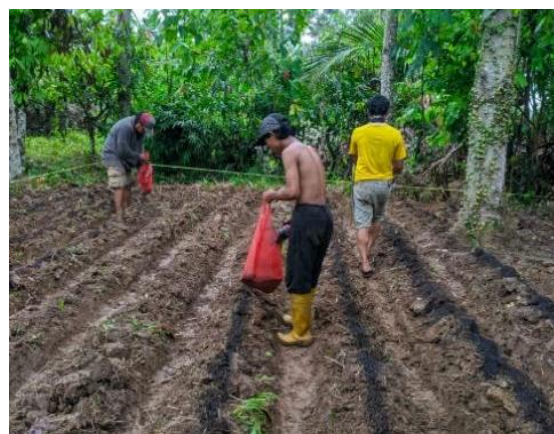
Gambar 8. Pelatihan Pemberian Pupuk Campuran