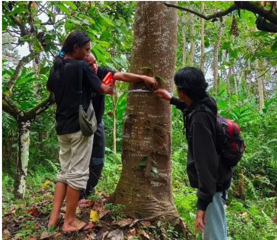
Gambar 4. Pengukuran Diameter Pohon Kemiri Bersama Masyarakat

Pada dasarnya masyarakat melakukan penanaman umbi-umbian tidak membuat bedeng. Karena penanaman dilakukan dibawah tegakan kemiri maka perlu dilakukan pelatihan. Pelatihan pembuatan bedeng dilakukan dengan cara sistem jalur mengikuti cahaya matahari dengan ketinggian bedeng setinggi 15 cm dengan lebar 20 cm. Pelatihan pembuatan pupuk kombinasi dengan mencampurkan pupuk kandang dan pupuk KCL dengan perbandingan 10 kg banding 2 kg, pelatihan ini juga dilakukan agar masyarakat mengetahui secara jelas cara pencampuran pupuk yang akan digunakan untuk luasan kebun percobaan sebesar 10x10 m.