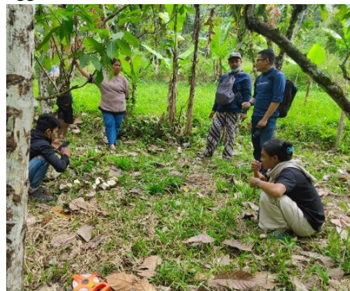
Gambar 3. Diskusi dengan Masyarakat Terkait Ketertarikan Penanaman Agroforestri

Hasil observasi kesiapan pengabdian ditemukan lahan-lahan yang mempunyai potensi untuk dijadikan kebun-kebun percobaan dan merujuk pada tahapan berikutnya dilakukan wawancara pemilik lahan dan kesediaan penggunaan lahan.