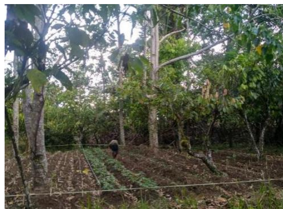
Gambar 10. Pelatihan Penanaman Umbi-umbian di bawah Tanaman Kemiri

Peningkatan pemahaman dapat dilihat dengan mengukur tingkat sikap masyarakat terhadap pengelolaan sistem agroforestri. Setelah dilakukan kegiatan pelatihan dimana awalnya masyarakat tidak tertarik melakukan sistem agroforestri setelah dilakukan pelatihan masyarakat mulai mencoba dilahan masing-masing. Berdasarkan hasil penelitian (Jasa et al., 2020) sikap masyarakat dalam pengelolaan lahan khususnya lahan sekitar hutan cenderung positif dalam memberikan pernyataan terkait pengelolaan sistem agroforestri karena berkaitan dengan bagaimana cara mengoptimalkan suatu lahan.