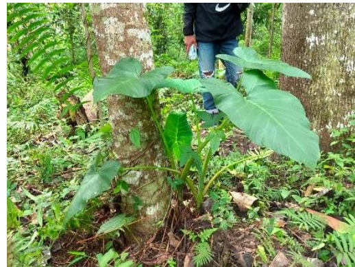
Gambar 2. Talas Yang Tumbuh di Bawah Kemiri

terdapat 4 lokasi yang cocok untuk dijadikan kebun percobaan, sedangkan hasil diskusi dengan masyarakat terkait ketertarikan untuk melakukan sistem agroforestri di lahan kemiri masih kurang dengan alasan umbi-umbian yang di bawah naungan tidak akan tumbuh dengan baik karena kurang mendapatkan matahari. Namun hasil observasi terdapat umbi-umbian lokal yang hidup secara alami di bawah tegakan kemiri, untuk itu perlu dilakukan pembuktian dengan melakukan praktek langsung penanaman umbi-umbian di bawah kemiri.