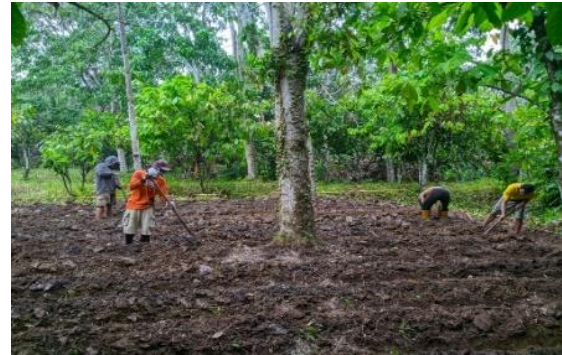
Gambar 6. Pelatihan Pembuatan Bedeng Dibawah Tanaman Kemiri

Hasil pelatihan pembuatan bedeng dan pupuk kombinasi meningkatkan pengetahuan masyarakat tentang sistem agroforestri khususnya tanaman umbi-umbian di bawah kemiri. Hal ini dibuktikan saat observasi awal masyarakat hanya melakukan penanaman secara turun menurun dan setelah pelatihan terjadi peningkatan pemahaman dalam pengelolaan sistem agroforestri.