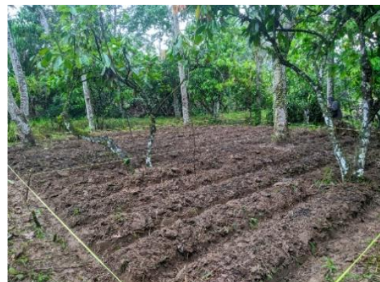
Gambar 7. Kebun Percobaan Yang Telah Selesai

Hasil pelatihan pembuatan bedeng dan pupuk kombinasi meningkatkan pengetahuan masyarakat tentang sistem agroforestri khususnya tanaman umbi-umbian di bawah kemiri. Hal ini dibuktikan saat observasi awal masyarakat hanya melakukan penanaman secara turun menurun dan setelah pelatihan terjadi peningkatan pemahaman dalam pengelolaan sistem agroforestri.