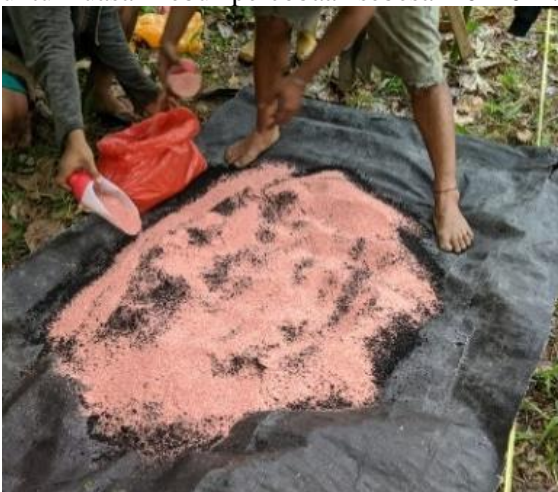
Gambar 5. Pelatihan Pembuatan Pupuk Kombinasi KCL dan Pupuk Kandang

Pada dasarnya masyarakat melakukan penanaman umbi-umbian tidak membuat bedeng. Karena penanaman dilakukan dibawah tegakan kemiri maka perlu dilakukan pelatihan. Pelatihan pembuatan bedeng dilakukan dengan cara sistem jalur mengikuti cahaya matahari dengan ketinggian bedeng setinggi 15 cm dengan lebar 20 cm. Pelatihan pembuatan pupuk kombinasi dengan mencampurkan pupuk kandang dan pupuk KCL dengan perbandingan 10 kg banding 2 kg, pelatihan ini juga dilakukan agar masyarakat mengetahui secara jelas cara pencampuran pupuk yang akan digunakan untuk luasan kebun percobaan sebesar 10x10 m.