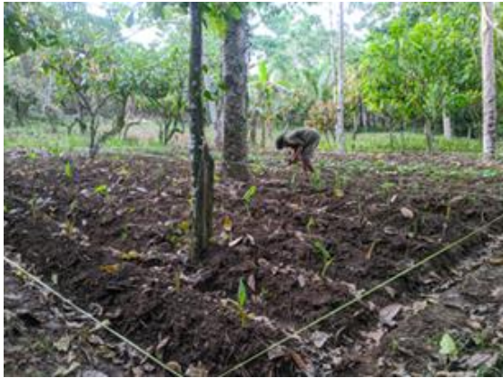
Gambar 9. Pelatihan Pemberian Pupuk Campuran