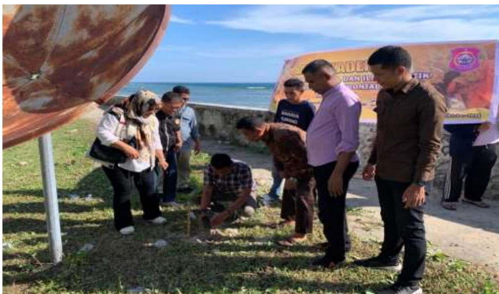
Gambar 3. Penanaman Pohon

ditanam juga berfungsi sebagai peyerap karbon, mengurangi konsentrasi gas rumah kaca di atmosfer, yang penting dalam memerangi perubahan iklim global. Penanaman pohon ternyata memiliki dampak yang jauh lebih besar dari sekadar penghijauan. Leontinus, G. (2022) menegaskan aktivitas penanaman pohon tidak hanya memperbaiki ekosistem pesisir, tetapi juga menjadi bagian dari strategi jangka panjang untuk mengembangkan potensi energi angin lokal. Pohon-pohon yang ditanam dengan pertimbangan spesifik mengenai jenis dan posisi tidak hanya berfungsi sebagai penghijauan, tetapi juga membantu mengarahkan pola aliran angin yang lebih stabil, yang nantinya dapat dimanfaatkan untuk pembangkit energi angin. Masyarakat yang sebelumnya tidak memahami potensi energi angin kini mulai menyadari bagaimana sumber daya alam yang ada di sekitar mereka bisa dimanfaatkan untuk kepentingan ekonomi, tidak hanya untuk menghijaukan lingkungan tetapi juga untuk menciptakan peluang baru dalam pengembangan energi terbarukan.