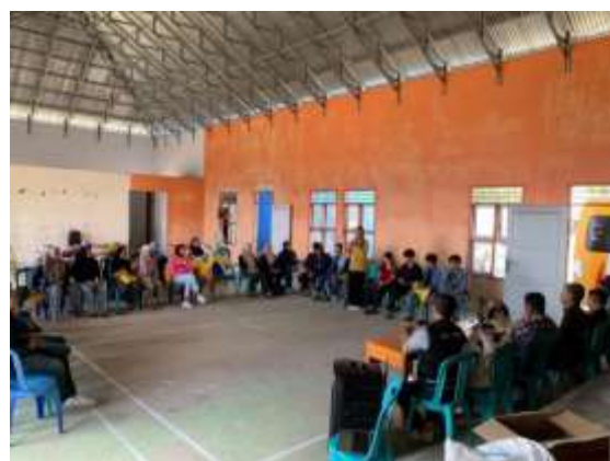
Gambar 2. Forum Group Discussion