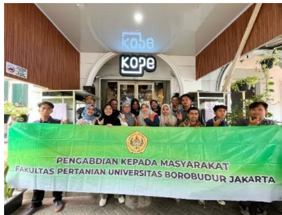
Gambar 4 : Kegiatan Pemberdayaan Karang Taruna

Hal ini selaras dengan penelitian oleh (Martin et al., 2013) yang menunjukkan bahwa pelatihan kewirausahaan yang bersifat praktik dan kontekstual dapat meningkatkan tiga aspek penting: pengetahuan kewirausahaan, niat berwirausaha, dan keterampilan perilaku. Pemberian ruang diskusi dalam pelatihan seperti ini terbukti menjadi salah satu metode efektif dalam mendorong keterlibatan aktif peserta dan membangun pengalaman reflektif yang berharga, sebagaimana disarankan oleh pendekatan experiential learning (Kolb, 1984). Pelatihan ini tidak hanya memberikan wawasan teknis, tetapi juga memfasilitasi proses pembentukan karakter dan kesiapan wirausaha melalui interaksi yang interaktif dan mendalam antara peserta dan fasilitator. Diharapkan, dengan pendampingan yang berkelanjutan, partisipan dapat mengatasi hambatan psikologis seperti kurangnya kepercayaan diri dan secara bertahap berani memulai usaha kopi yang berdaya saing. Kegiatan ini tidak hanya menjawab kebutuhan edukasi kewirausahaan berbasis potensi lokal, tetapi juga memperkuat peran pemuda dalam membangun ekonomi komunitas yang berdaya saing melalui sektor pertanian kreatif, khususnya dalam pengolahan produk kopi. Kegiatan ini ditutup dengan sesi foto bersama terdapat di dalam Gambar 4.