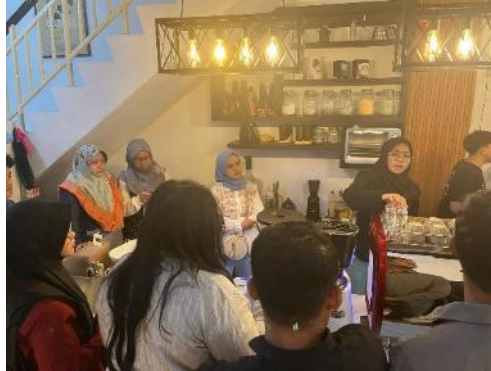
Gambar 3 : Pelatihan Olahan Kopi

Berdasarkan hasil pelatihan olahan minuman kopi yaitu kopi gula aren, partisipan melakukan diskusi mendalam dengan fasilitator, seperti terpapar pada beberapa pertanyaan di Tabel 1: