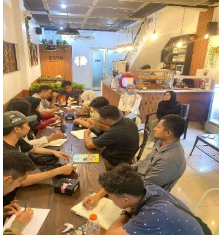
Gambar 2 : Penyampaian Materi Kewirausahaan

Berdasarkan penyuluhan yang dilakukan terlihat partisipan telah mempunyai pengetahuan dan sikap yang cukup tentang berwirausaha pada bidang pertanian melalui diskusi yang berlangsung, namun partisipan menunjukkan kurang didalam perilaku atau tindakan nyata dalam melaksanakan kewirausahaan pada bidang pertanian. Pengetahuan dan sikap diukur melalui diskusi yang termasuk dalam metode kualitatif berbaris interaksi, tindakan perilaku dievaluasi melalui observasi baik selama kegiatan berlangsung maupun dari tindak lanjut serta penyuluhan. Penyuluhan dan pelatihan membantu partisipan dalam meningkatkan pengetahuan dan sikap maupun motivasi namun memang belum dapat meningkatkan perilaku secara optimal. Masih adanya keragu-raguan partisipan dalam bertindak kemungkinan disebabkan belum percaya dirinya partisipan dalam memulai berwirausaha (Oktavia, 2020).