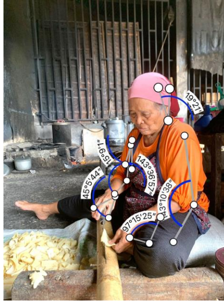
Gambar 2 Postur dan sudut pekerja yang dianalisis

Perhitungan REBA dilakukan dengan mengukur sudut postur tubuh pada bagian tertentu.