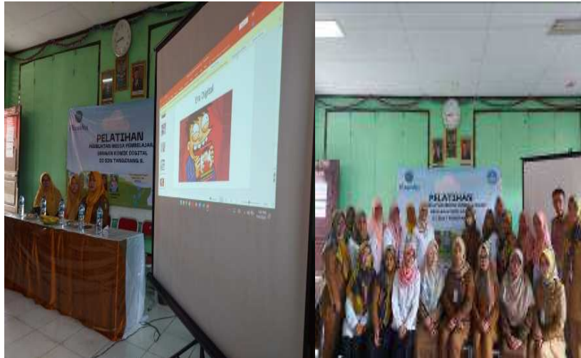
Gambar 3. Kegiatan Hari Ke-2

Hasil pembuatan komik digital yang telah dibuat oleh para peserta