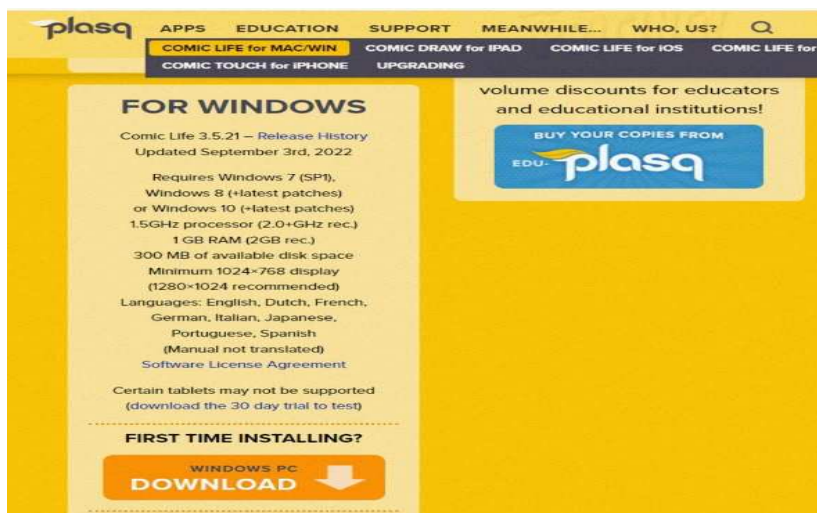
Gambar 1. Halaman depan Web PlasQ

lainnya. Dengan penggunaan media pembelajaran Komik Digital dapat menciptakan pembelajaran yang lebih aktif, kreatif, dan inovatif sehingga materi yang disampaikan dapat dengan mudah dipahami oleh peserta didik (Narestuti et al., 2021). Aplikasi PlasQ merupakan salah satu perangkat lunak yang diciptakan pada tahun 2005 untuk mengeluarkan potensi luar biasa dari sistem komputer masa kini khususnya dalam pembuatan bahan bacaan komik ( PlasQ The Secret Origin , 2024).