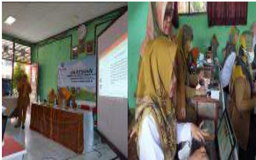
Gambar 2. Kegiatan Hari Ke-1

tatacara dan langkah mengakses dan membuat akun PlasQ serta dilanjutkan dengan membuat akun dan memberikan contoh secara langsung cara membuat komik digital dengan aplikasi PlasQ, setelah sesi pemaparan selesai, peserta mengikuti langkah yang sudah diajarkan mulai dari membuka akun kemudian menggunakan fitur yang disediakan dan mencoba membuat komik digital. Setiap guru mencoba membuat komik digital menggunakan aplikasi PlasQ (Gambar 1)