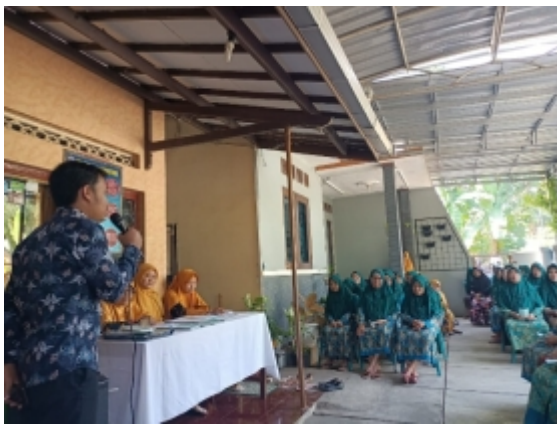
Gambar 3. Penyuluhan Kesehatan Hipertensi dan Diabetes Mellitus di Desa Bae, Kudus

Edukasi kesehatan masyarakat dapat dilakukan dengan berbagai cara. Salah satu cara adalah melalui penyampaian informasi dan edukasi kesehatan dengan menggunakan media pembelajaran yang dapat dan mudah diakses masyarakat setiap hari (Mighra, B.A. and Djaali, W, 2020). Upaya pencegahan dan pengelolaan hipertensi dan DM di rumah dengan menggunakan media pembelajaran yang menarik dapat meningkatkan pemahaman bagi masyarakat. Upaya ini dapat meningkatkan pengetahuan, pemahaman, kesadaran masyarakat untuk pencegahan dan pengelolaan hipertensi dan DM di rumah, sehingga mampu mengontrol kejadian hipertensi dan DM di masyarakat.