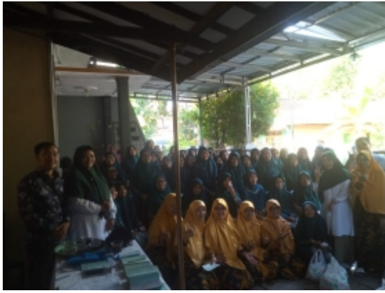
Gambar 2. Pelaksanaan Pengabdian kepada Masyarakat di Desa Bae, Kudus