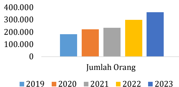
Gambar 1. Data kecelakaan kerja 5 tahun terakhir dari BPJS [10]

Masalah K3 atau Occupational Safety and Health (OSH) secara umum di Indonesia masih sering terabaikan [9]. Hal ini ditunjukkan dengan masih tingginya angka kecelakaan kerja. Berdasarkan data BPJS Ketenagakerjaan angka kecelakaan kerja di Indonesia dalam lima tahun terakhir cenderung meningkat. Gambar 1 merupakan data BPJS Ketenagakerjaan mengenai jumlah kecelakaan kerja yang terjadi di Indonesia: