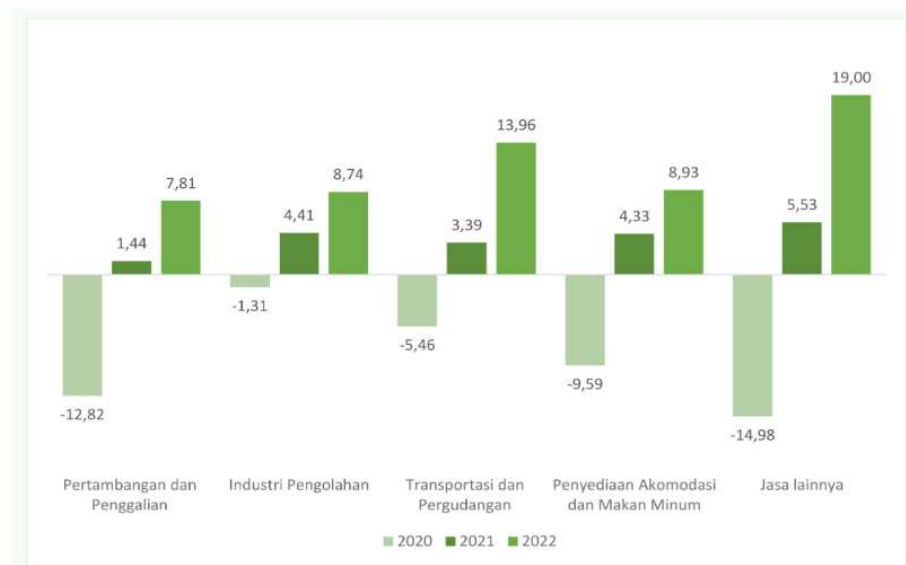
Gambar 1. Perkembangan Ekonomi Gresik.

Pusat Statistik, n.d.). Hal ini menunjukkan bahwa pertumbuhan ekonomi di Kabupaten Gresik terbilang sangat pesat.