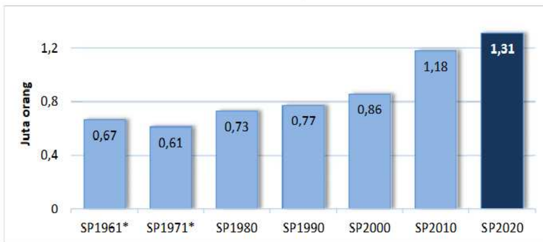
Gambar 2. Pertumbuhan Penduduk Kabupaten Gresik

(konveksi). Di sebelah utara kota Gresik, juga di kota Sedayu, merupakan penghasil sarang burung walet terbesar di Indonesia.