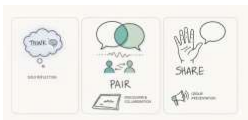
Gambar 1. Think Pair Share

menjadi dasar untuk pengembangan keterampilan berpikir kritis. Kemudian, pada fase berpasangan, siswa mencari pasangan untuk mendiskusikan hasil pemikiran mereka sebelumnya. Saat berdiskusi, siswa memerlukan keterampilan berpikir kritis dan keterampilan komunikasi yang baik. Fase terakhir adalah berbagi, di mana siswa membagikan hasil diskusi mereka dengan pasangan kepada seluruh kelas; untuk menyampaikan ini secara efektif, siswa harus memiliki kepercayaan diri yang kuat (Widyastuti, 2017).