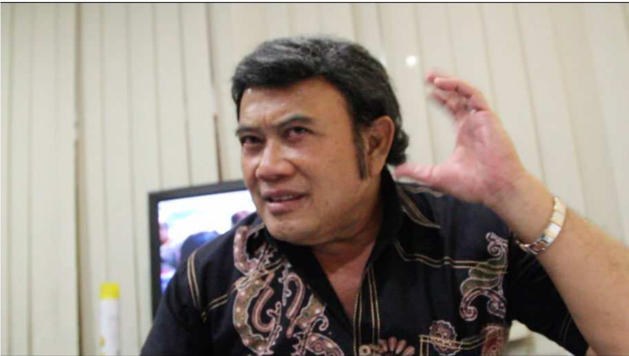
Gambar 2. Wawancara dengan Rhoma Irama