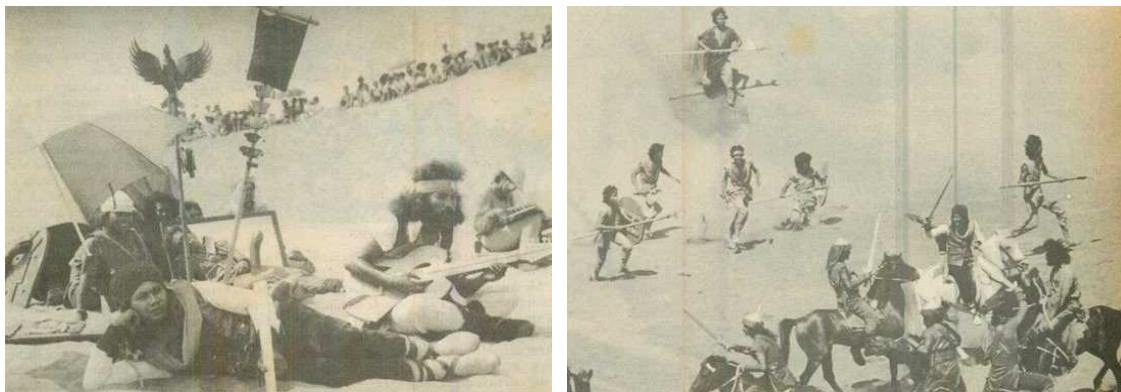
Gambar 3. Istirahat waktu pembuatan dalam "Satria Bergitar"

tentang kebenaran yang ada pada kehidupan normal menuntut kehidupan normative (Hall, 1997:13). Dalam pendekatan ini, reflective lebih menekankan apakah bahasa telah mampu mengekspresikan makna yang terkandung dalam objek yang bersangkutan. Pendekatan reflective menjelaskan bahwa makna dipahami untuk mengelabui objek. Komunikasi pribadi pada April 2012, dengan Rhoma Irama bahwa dalam film Satria Bergitar Rhoma Irama, ide awal dalam gitar itu bisa mengeluarkan panah, tetapi karena secara teknis tidak tercapai akhirnya gitar itu mengeluarkan peluru dan ada magis pada gitar itu suara bisa membuat telinga merasa sakit.