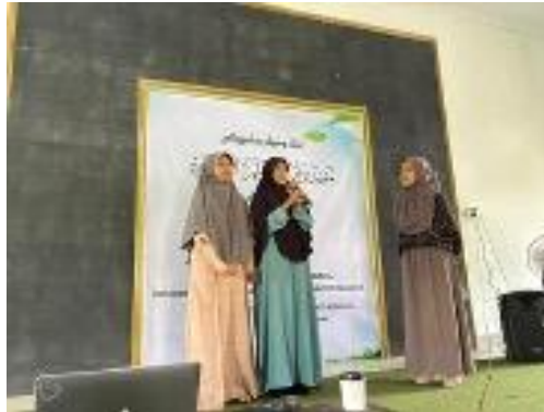
Gambar 3. Peserta Melakukan Sesi Sharing Bersama Psikolog