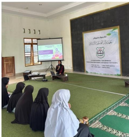
Gambar 3. Peserta Mengikuti Pemaparan Materi dari Narasumber