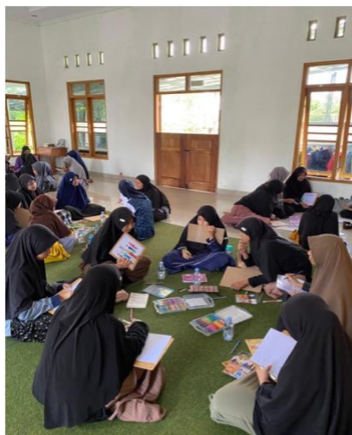
Gambar 2. Identifikasi Permasalahan melalui Kegiatan Art Therapy

Pada tahap awal ini, ketua tim dan anggota tim melaksanakan kegiatan identifikasi dan pemilihan mitra panti asuhan. Kegiatan ini akan dilaksanakan di Panti Asuhan sekaligus pondok pesantren Daarul 'Ilmi Sembada yang beralamat di Jalan Magelang No.Km.11, Pisangan, Tridadi, Kec. Sleman, Kabupaten Sleman, Daerah Istimewa Yogyakarta. Identifikasi awal yang ada di panti asuhan ini antara lain kesulitan dalam membangun hubungan interpersonal, kecemasan, kesepian, serta support system yang mereka miliki ada yang sudah bagus ada pula yang masih perlu ditingkatkan. Data awal ini tim dapatkan dari hasil kegiatan Art Therapy yang telah dilakukan pada tahun sebelumnya di tempat ini.