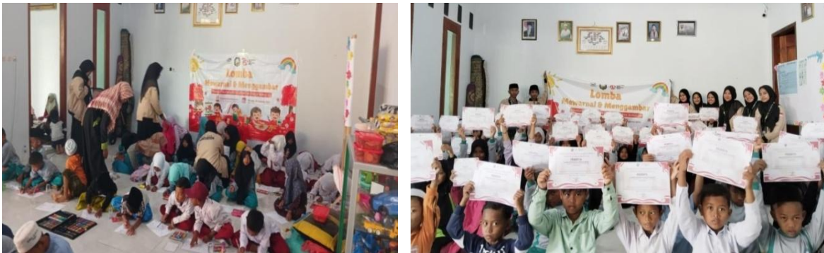
Gambar 5. Pelaksanaan Lomba Mewarnai Dan Menggambar

gradasi warna, yang tercermin dari hasil karya mereka yang lebih menarik dan memiliki kedalaman visual. Sebagai contoh, peserta yang sebelumnya hanya mampu menggunakan warna tunggal dalam satu objek, kini dapat mengaplikasikan dua atau lebih warna dengan peralihan yang lebih halus. Ini menunjukkan keberhasilan teknik pengajaran yang diterapkan selama program. Pengukuran keterampilan ini dilakukan dengan menggunakan instrumen penilaian berupa rubrik yang menilai kerapian, kehalusan gradasi warna, dan ketepatan dalam penerapan teknik gradasi. Sebagian besar anak-anak menunjukkan peningkatan dalam hal kehalusan gradasi dan pemilihan warna yang lebih tepat, seperti yang ditunjukkan dalam karya mereka setelah mengikuti pelatihan.