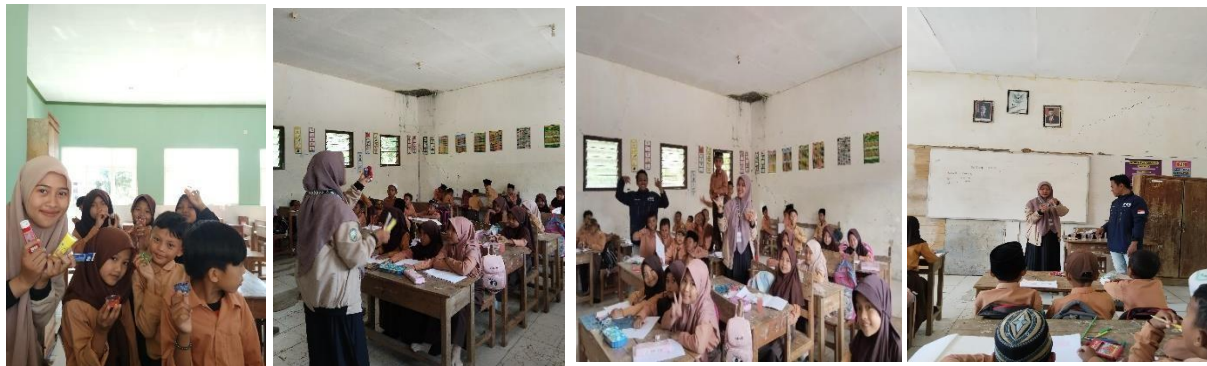
Gambar 4. Pelaksanaan Pendampingan Teknik Gradasi Warna

Pelaksanaan program pendampingan seni gradasi warna di Desa Mano'an telah memberikan hasil yang signifikan dalam meningkatkan keterampilan mewarnai dan menggambar anak-anak, khususnya dalam menguasai teknik gradasi warna. Hasil observasi menunjukkan bahwa setelah mengikuti sesi pembelajaran, anak-anak mulai menunjukkan kemajuan yang nyata dalam menerapkan teknik gradasi warna yang sebelumnya tidak mereka kuasai. Program ini tidak hanya memberikan keterampilan teknis, tetapi juga memberikan dampak positif terhadap pengembangan kreativitas dan keterampilan motorik halus anak-anak. Sebelum mengikuti program, sebagian besar anak-anak yang terlibat dalam kegiatan ini memiliki keterampilan mewarnai yang terbatas, di mana mereka hanya mampu mewarnai objek dengan satu warna tanpa memperhatikan pencampuran warna yang harmonis. Namun, setelah melalui serangkaian pelatihan yang mengajarkan teknik gradasi warna, banyak dari mereka mampu membuat transisi warna yang lebih halus, seperti dari warna gelap ke terang atau dari satu warna ke warna lainnya dengan transisi yang lebih natural.