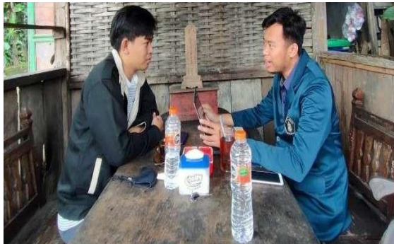
Gambar 6. Review Kebijakan Akuntansi dan Penyusunan Laporan Keuangan

penjelasan yang lebih mendetail terkait kebijakan akuntansi. Dua minggu kemudian, mitra dengan didampingi oleh mahasiswa pengabdian melakukan pengisian mutasi laporan keuangan. Mutasi laporan keuangan berguna untuk mengelompokkan nominal dari setiap akun-akun dalam akuntansi. Pengisian mutasi keuangan berlangsung satu bulan. Dua minggu berikutnya digunakan untuk melakukan penyusunan laporan keuangan. Pada akhir tahapan ini mahasiswa menguji pemahaman sumber daya manusia yang ditujuk terkait pembuatan laporan keuangan.