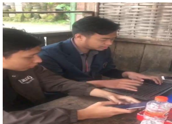
Gambar 5. Pelatihan Pencatatan Keuangan Secara Real Time Berbasis Teknologi

Kegiatan kedua pada tahapan ini adalah pelatihan pencatatan keuangan berbasis teknologi. Langkah awal, mitra mengumpulkan semua catatan yang berhubungan dengan penerimaan dan pengeluaran selama tahun 2022. Selanjutnya mitra bersama mahasiswa pengabdian merekap keuangan di MS Excel yang sudah dimodifikasi sesuai dengan kebutuhan manajemen keuangan cafe. Setelah semua dilakukan perekapan, MS Excel tersebut dijadikan spreadsheet. Hal ini dilakukan agar catatan keuangan bisa dilakukan secara real time dan bisa diakses melalui smartphone .