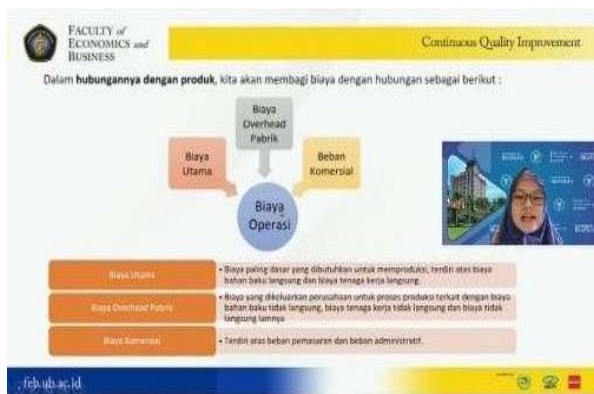
Gambar 3. Pemaparan Materi pada Mitra secara Daring

Tahapan selanjutnya dinamakan tahap tindakan. Pada tahapan ini dosen pengabdian masyarakat memaparkan materi secara daring dan dilakukan selama dua hari. Pada hari pertama pemaparan bertemakan penentuan harga produk. Pada hari kedua pemaparan mengusung topik laporan keuangan UMKM. Untuk mengetahui tingkat pemahaman mitra terhadap materi maka dibagikan post test setelah pemaparan materi. Adanya post test ini juga dapat memberikan bahan evaluasi untuk tim pengabdian masyarakat. Sehingga dapat meningkatkan kinerja pengabdian pada tahap selanjutnya.