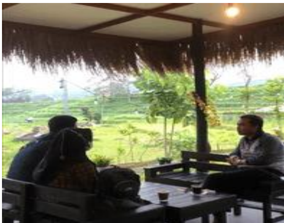
Gambar 2. Diskusi Permasalahan Keuangan Mitra Secara Luring

Diskusi kedua dilakukan secara luring antara tim pengabdian dan manajer operasional UMKM. Pada diskusi ini, tim pengabdian juga melakukan investigasi terkait bagaimana penentuan harga produk cafe selama ini dan bagaimana bentuk pencatatan keuangan cafe. Dalam investigasi ini didapat dua permasalahan yang berhubungan dengan permasalahan yang didapat pada diskusi awal. Permasalahan pertama, cafe dalam menentukan harga produk berdasarkan harga dari beberapa cafe lain dan hanya menghitung dari biaya bahan baku pembuatan setiap produknya. Permasalahan kedua yaitu belum adanya penggolongan biaya dan pencatatan keuangan sederhana serta belum bisa dilakukan secara real time .