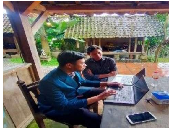
Gambar 4. Pelatihan Penentuan Harga Produk

sela pengabdian ini dosen juga secara virtual memberikan arahan kepada manajer bagaimana cara mendapatkan pendanaan dari pihak eksternal.