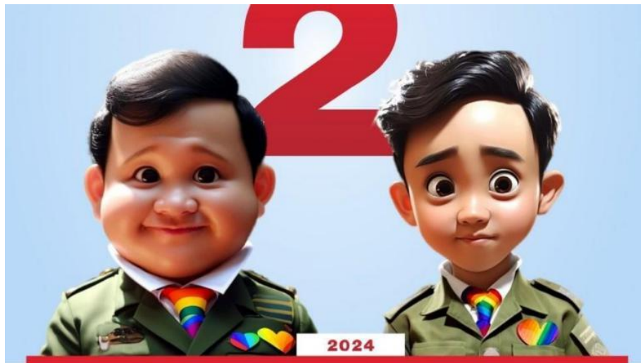
Gambar 5. Foto AI paslon 2

Kebiasaan unik Prabowo yang suka berjoget di hampir setiap acara yang ia datang menimpulkan tren baru lain di kalangan masyarakat, yaitu “Joget Gemoy”. Dan tren ini banyak terjadi di media sosial Tiktok dan Instagram yang biasanya diiringi dengan lagu “Oke Gas”. Menurut media monitoring PARA Syndicate pada 23-30 November 2023, rata-rata tagar dalam dalam kata kunci “Prabowo” dan “gemoy” disebarluaskan oleh para pendukung dengan lokasi terbanyak di Jakarta, Jawa Barat, dan Jawa Timur. Tagar paling banyak digunakan adalah #prabowogemoy (Susanto, 2024).