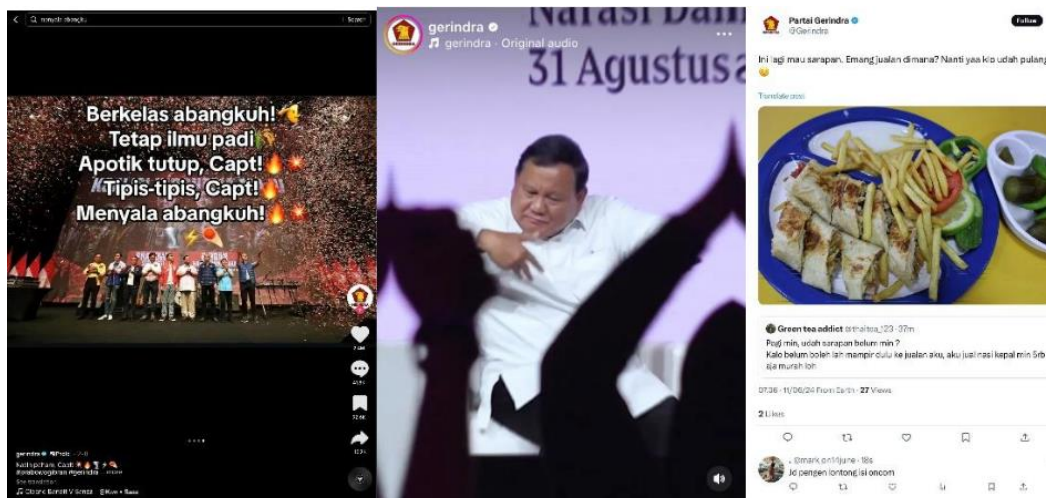
Gambar 6. Perubahan gaya komunikasi partai Gerindra dalam berkampanye

Tren “Gemoy” ini begitu viral hingga mengalahkan tren yang dibentuk oleh paslon lainnya. Dikutip dari kumparan News, sebanyak 63,3% responden mengaku tahu/pernah dengar dan hanya 36,7% yang menjawab tidak tahu (Rahardian, 2024). Meskipun begitu tren joget gemoy ini memang menuai pro dan kontra di beberapa pengguna media. Menurut Katadata, Tiktok dan X (Twitter) adalah dua platform media sosial tempat viralnya kata kunci gemoy. Di Tiktok, goyang gemoy Prabowo memiliki kecenderungan mendapat sentimen positif. Sedangkan di platform X, sentimen terhadap gemoy memiliki kecenderungan negatif (Susanto, 2024).