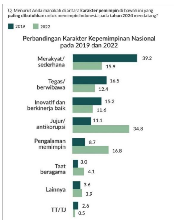
Gambar 3. Hasil Survei Terkait Perbandingan Karakter Kepemimpinan Nasional Pada 2019 Dan 2022