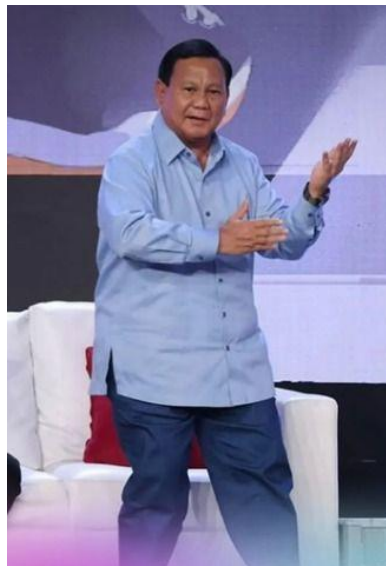
Gambar 5. Foto Prabowo dengan Goyang Gemoy

Branding “Gemoy” menciptakan kontras yang signifikan dengan citra Prabowo yang sebelumnya keras dan tegas, kini tampil lebih lembut, lucu, dan menggemaskan. Perubahan ini ditunjukkan melalui gerakan menari yang mencerminkan ekspresi diri yang santai dan menyenangkan, menarik perhatian publik dan membuatnya terlihat lebih humanis. Respon positif dari publik, terutama di media sosial, memperkuat citra baru ini melalui meme dan video yang menyorot sisi lucunya. Secara visual, branding ini dapat diwakili oleh warna lembut dan simbol-simbol positif, yang membuatnya lebih mudah diterima secara emosional oleh masyarakat.