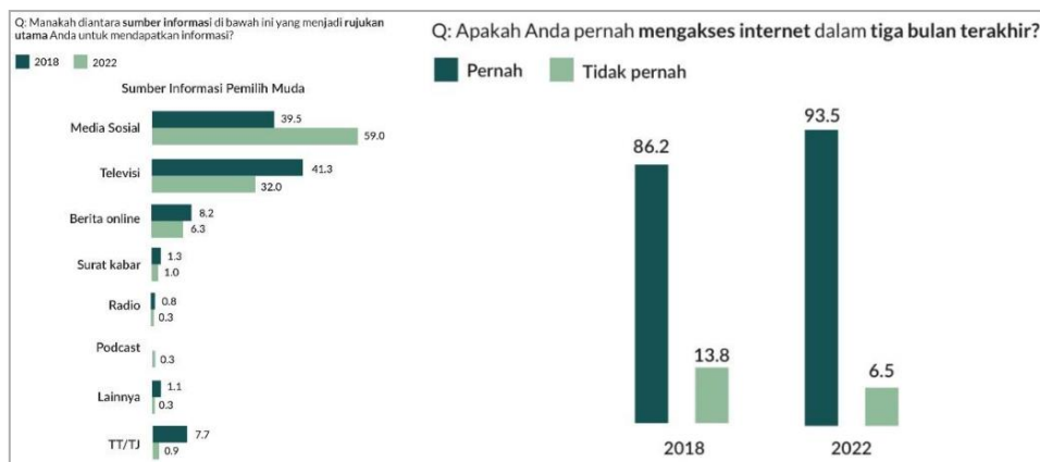
Gambar 2. Hasil Survei terkait sumber informasi pemilih muda (kanan) dan pengaksesan internet (kiri)

Hasil Laporan Survei Pemilih Muda kepada 1192 responden (17-39 tahun) pada periode 8-13 Agustus 2022 oleh CSIS Indonesia, menunjukkan bahwa anak muda kini menjadikan media sosial sebagai sumber referensi informasi utama. Pada tahun 2018, hanya 39.5 persen anak muda yang mengakses informasi lewat media sosial, sementara sisanya sebanyak 42.3 persen memilih untuk mengakses lewat televisi. Namun, semua itu berubah drastis pada tahun 2022 di mana 59 persen anak muda memilih media sosial sebagai sumber informasi, sedangkan akses terhadap televisi hanya di angka 32 persen saja (Fernandes, Suryahudaya and Okthariza, 2023). Maka dari itu strategi kampanye yang berfokus pada media sosial adalah pilihan terbaik dalam menggaet anak muda.