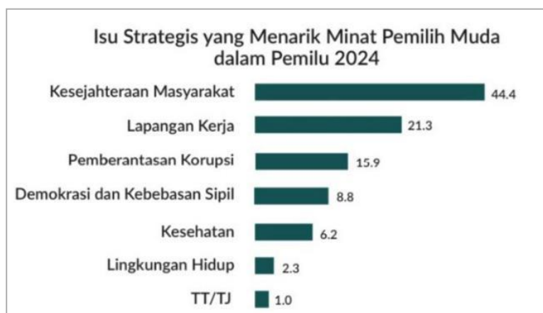
Gambar4. Hasil Survei Terkait Isu Strategis yang Menarik Minat Pemilih Muda dalam Pemilu 2024

Terdapat 3 isu teratas yang paling diminati oleh pemilih muda, pertama tentang keejahtreraan masyarakat dengan persentase sebanyak 44,4 %, diikuti isu tentang lapangan pekerjaan dengan 21,3 % dan yang terakhir tentang pemberantasan korupsi dengan 15,9 % (Fernandes, Suryahudaya and Okthariza, 2023).