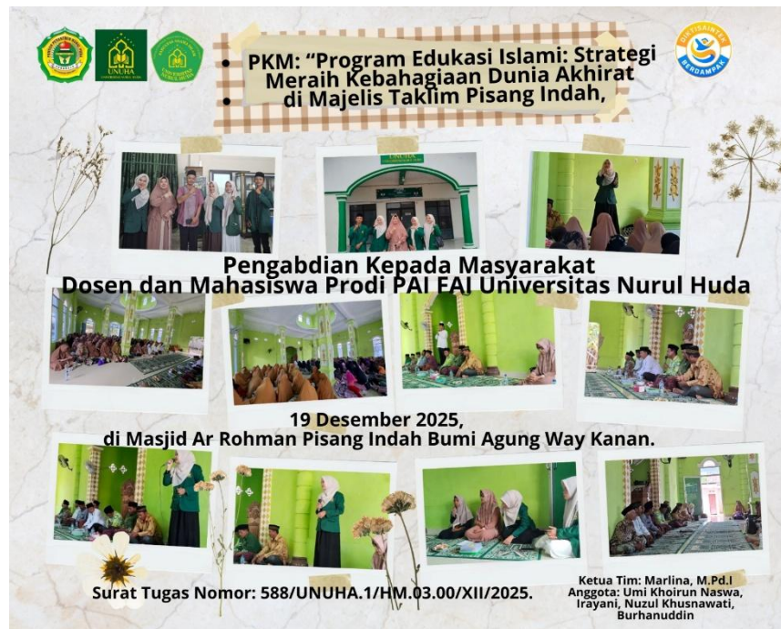
Gambar 1. Pelaksanaan PKM

memfasilitasi solusi kontekstual dan memperkuat rasa memiliki peserta terhadap proses pembelajaran. Berdasarkan post-feedback, sekitar 85% peserta menilai materi “jelas dan bermanfaat”, menunjukkan bahwa pendekatan penyampaian dan interaksi dalam kegiatan ini telah tepat sasaran.