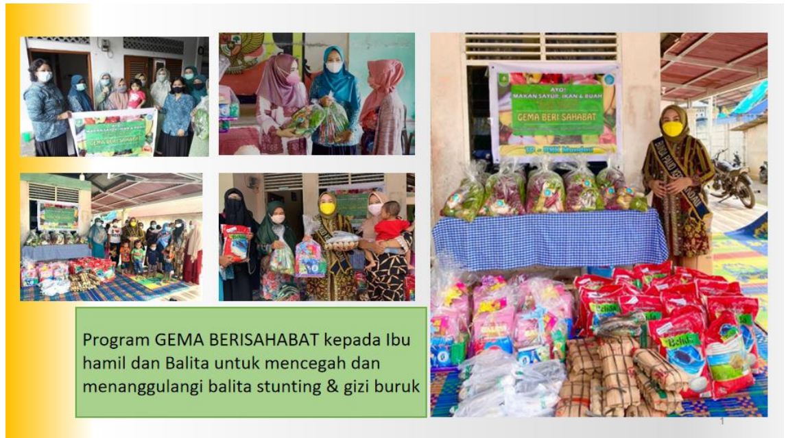
Sumber : Laporan Mini Lokakarya Kecamatan Mandau

Jadi secara garis besar program yang dilakukan Pemerintah dalam hal ini Kecamatan Mandau Kabupaten Bengkalis dalam Pencegahan stunting ini bertujuan untuk mencegah kasus kekurangan gizi dan kasus beresiko stunting terutama pada balita. Oleh karena itu Kecamatan Mandau Kabupaten Bengkalis melakukan upaya peningkatan kualitas makanan dan minuman, serta melakukan sosialisasi terkait kasus stunting kepada masyarakat khususnya bagi balita dan ibu hamil.