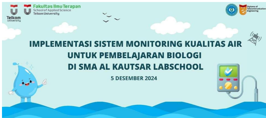
Gambar 2 Spanduk kegiatan pengabdian kepada masyarakat di SMA Al Kautsar Labschool

Bulan 2: Implementasi Teknologi dan Pelatihan