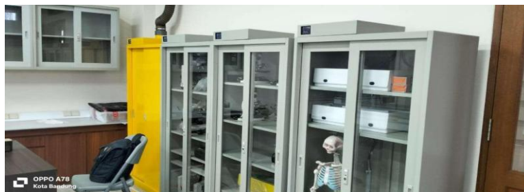
Gambar 6 Penempatan Alat Ukur Kualitas air di laboratorium Biologi SMA AI Kautsar Labschool