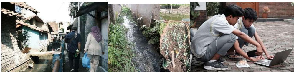
Gambar 3 Lokasi pengukuran kualitas air dan partisipasi siswa SMA Al Kautsar Labschool dalam menganalisis hasil pengukuran

Output: Tim internal siap menggunakan sistem.