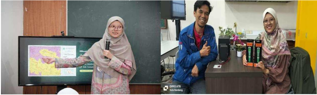
Gambar 4 Pelatihan penggunaan alat ukur kualitas air dan serah terima alat ukur ke perwakilan guru biologi SMA AIKautsar Labschool

Output: Evaluasi kurikulum dan metode pengajaran yang diterapkan.