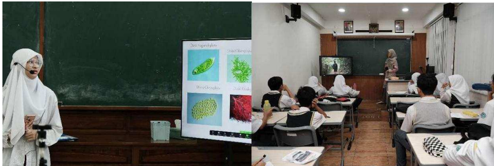
Gambar 5 Presentasi Siswa dan ujicoba pemahaman siswa SMA AIKautsar Labschool terhadap materi pelatihan yang diberikan

Output: Peningkatan kesadaran lingkungan dan kontribusi terhadap evaluasi proyek.