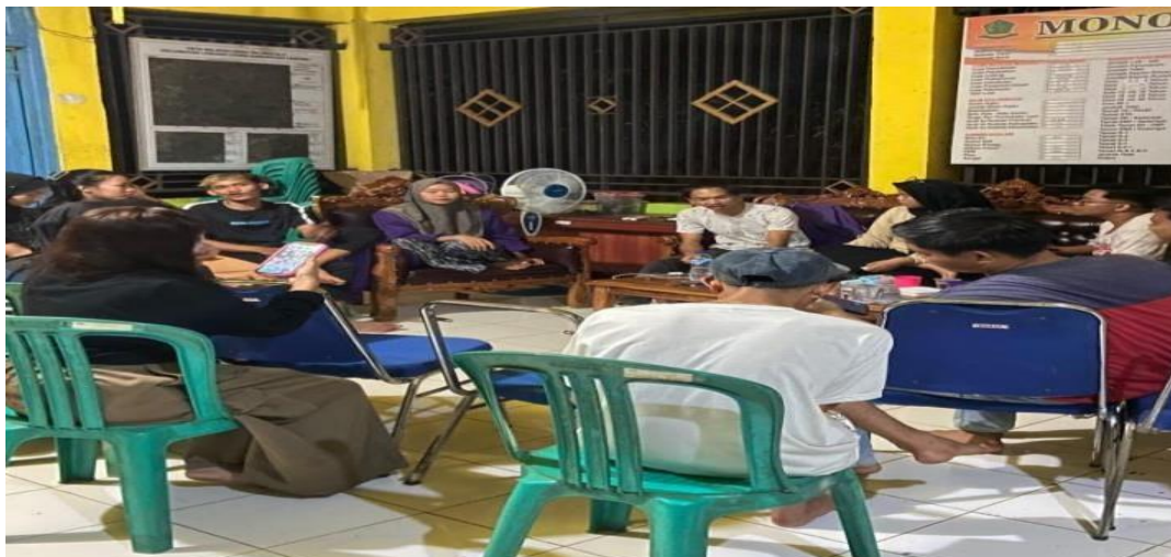
Gambar 1. Pembukaan