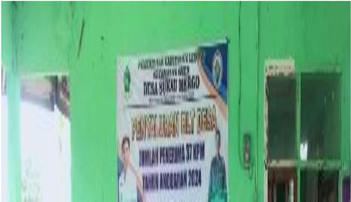
Gambar 3. Pemasangan Tanda Titik Lokasi