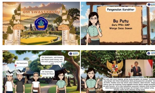
Gambar 2. Media komik digital berbasis tri hita karena

Tahap Pengembangan ( development ) dilakukan dengan pembuatan media komik digital berbasis tri hita karena yang tepat terhadap prototipe (rancang bangun) berbentuk naskah dialog dan storyboard yang selesai disusun dan disetujui kedua dosen pembimbing. Media komik digital berbasis tri hita karena tersusun menjadi tiga bagian, meliputi bagian pembuka, isi dan penutup.