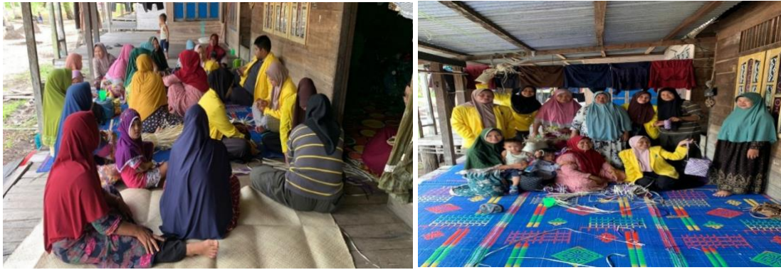
Gambar 4. Sosialisasi dan pelatihan tentang cara mengolah daun pandan duri menjadi produk yang kreatif dan inovatif