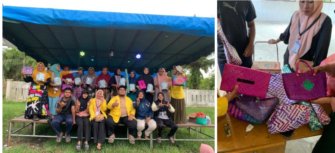
Gambar 5. Hasil produk anyaman daun pandan duri.