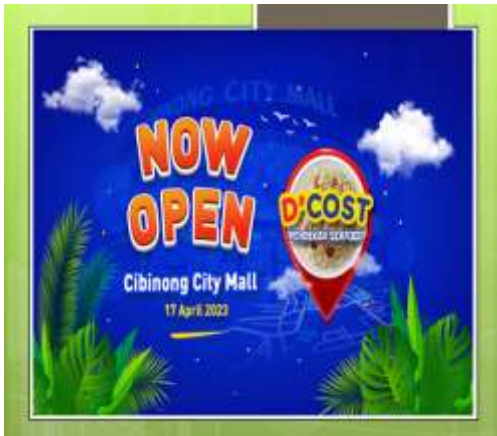
Gambar 4. Contoh iklan dalam Bahasa Inggris dari D'Cost

Setelah pemateri menjelaskan urgensi dari penggunaan bahasa Inggris pada iklan untuk pemasaran produk, pemateri memberikan contoh beberapa iklan dari produk ternama yang menggunakan Bahasa Inggris.