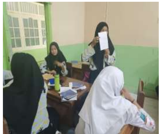
Gambar 5. Peserta mempresentasikan hasil kerja kelompok

Pemateri meminta peserta untuk membuat iklan sesuai dengan produk yang mereka ingin pasarkan. Kegiatan selanjutnya yaitu setiap peserta melakukan persentasi hasil yang telah dikerjakan kelompoknya berupa karya iklan berbahasa Inggris. Selama pelatihan peserta diberikan masukan, saran dan koreksi terhadap penulisan, berupa pemilihan kata yang menarik sesuai dengan produk masing-masing, pengucapan bahasa Inggris pada setiap kata yang dituliskan. Walaupun awalnya peserta merasa kurang percaya diri, namun mereka melakukan kegiatan dengan sangat baik. Terlihat dari hasil iklan yang mereka buat bervariasi dan menarik.