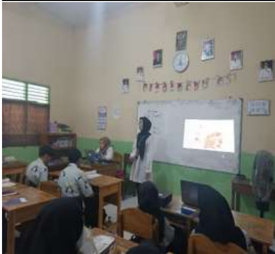
Gambar 3. Pemaparan Pengaplikasian Bahasa Inggris pada Iklan

Setelah pemateri menjelaskan urgensi dari penggunaan bahasa Inggris pada iklan untuk pemasaran produk, pemateri memberikan contoh beberapa iklan dari produk ternama yang menggunakan Bahasa Inggris.