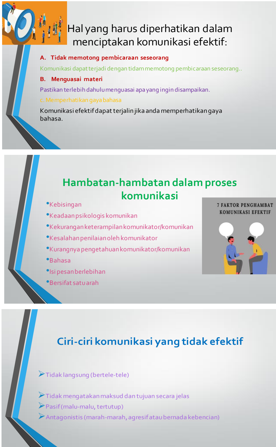
Gambar 1-7 materi yang disampaikan di pelatihan komunikasi efektif