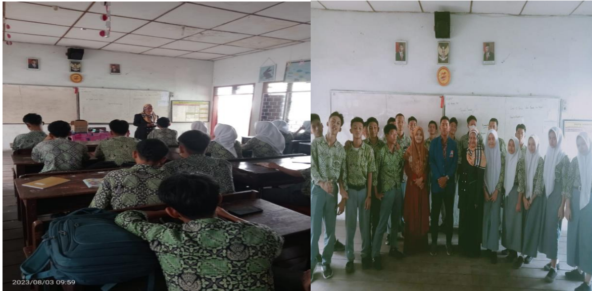
Gambar 8-9. Foto penyampaian materi dan foto bersama siswa/i SMA Taman siswa Medan