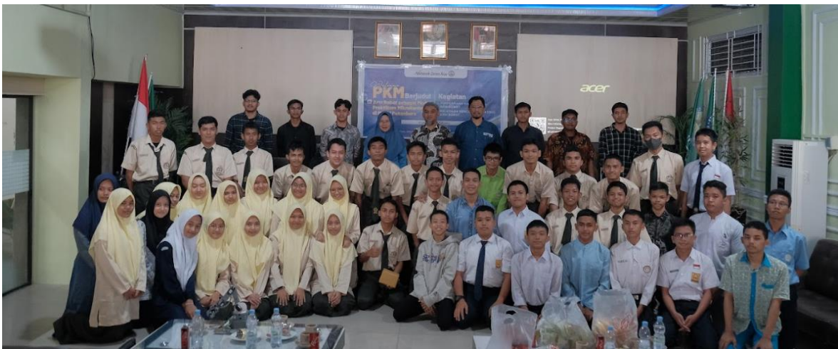
Gambar 4. Hasil Pelaksanaan Pelatihan PkM

Setelah menghasilkan arm robot langkah selanjutnya yang telah di laksanakan adalah kegiatan pelatihan penggunaan arm robot. Adapun kegiatan tersebut dapat di lihat pada Gambar 4.