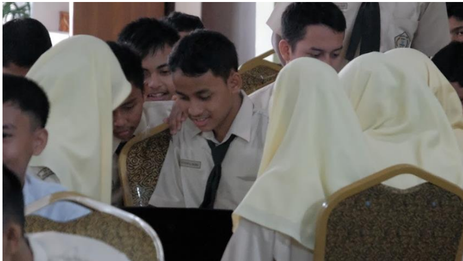
Gambar 7. Kerja Team dalam Tugas

Setelah melakukan pelatihan dalam kegiatan PKM selanjutnya melakukan penyerahan modul arm robot sebagai sarana pembelajaran selanjutnya bagi siswa di MAN 1 Pekanbaru khusus bidang minat robotik. Adapun penyerahan dapat di lihat pada Gambar 8. Dan pihak MAN 1 Pekanbaru mengucapkan terima kasih atas kegiatan ini dan sangat berharap kedepannya dapat kerja sama dalam mengembangkan bidang robotik, salah satu yang di harapkan adalah kegiatan penggunaan 3D printing bagi siswa robotik.