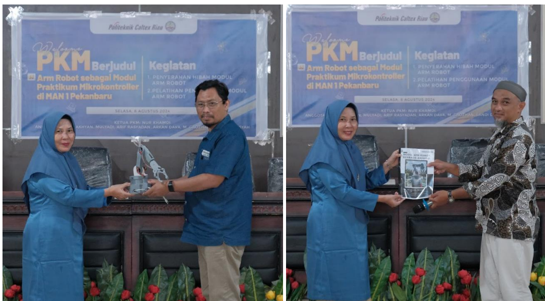
Gambar 8. Penyerahan Arm Robot dan Penyerahan Modul Arm Robot

Setelah melakukan pelatihan dalam kegiatan PKM selanjutnya melakukan penyerahan modul arm robot sebagai sarana pembelajaran selanjutnya bagi siswa di MAN 1 Pekanbaru khusus bidang minat robotik. Adapun penyerahan dapat di lihat pada Gambar 8. Dan pihak MAN 1 Pekanbaru mengucapkan terima kasih atas kegiatan ini dan sangat berharap kedepannya dapat kerja sama dalam mengembangkan bidang robotik, salah satu yang di harapkan adalah kegiatan penggunaan 3D printing bagi siswa robotik.