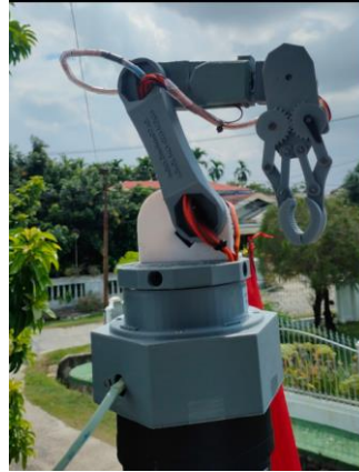
Gambar 3. Hasil Arm Robot

Dalam pembuatan arm robot sebagai alat yang dihibahkan ke MAN 1 Pekanbaru sebagai sarana belajar robotik telah di kerjakan di kampus PCR. Adapun hasil arm robotnya dapat di lihat pada Gambar 3.