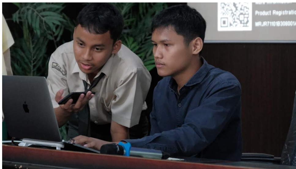
Gambar 5. Hasil STEM

Berdasarkan Gambar 5, terlihat bahwa peserta dapat berkomunikasi hasil teknologi yang telah di buat dengan nara sumber dalam kegiatan PkM. Hasil teknologi yang telah dihasilkan oleh peserta di uji coba pada arm robot. Sebagai apresiasi peserta yang telah berhasil lebih cepat di beri hadiah seperti pada Gambar 6.