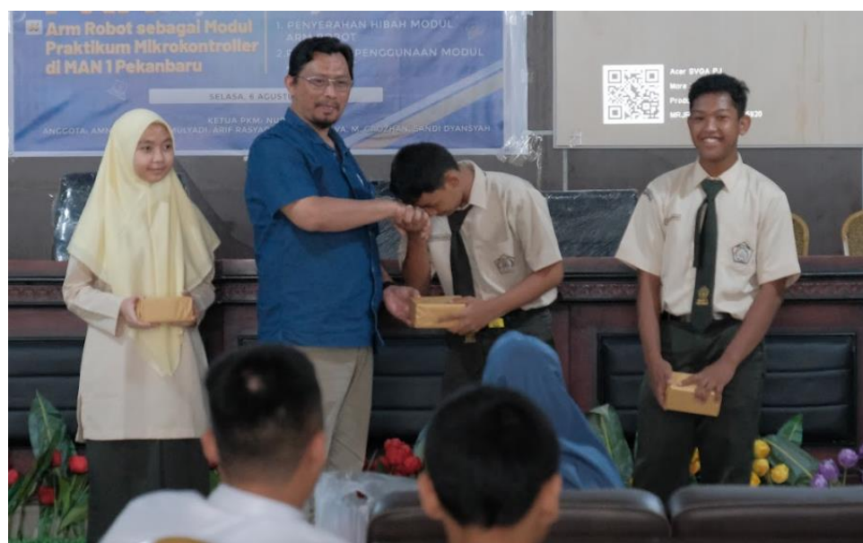
Gambar 6. Pemberian Hadiah bagi Peserta lebih Cepat

Berdasarkan Gambar 5, terlihat bahwa peserta dapat berkomunikasi hasil teknologi yang telah di buat dengan nara sumber dalam kegiatan PkM. Hasil teknologi yang telah dihasilkan oleh peserta di uji coba pada arm robot. Sebagai apresiasi peserta yang telah berhasil lebih cepat di beri hadiah seperti pada Gambar 6.