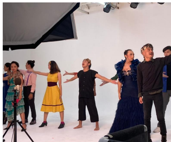
Gambar 2. Salah satu adegan “Kabayan Metropolitan” ketika Reherasal

dengan fenomena zaman sekarang. Berfokus kepada kolaborasi budaya sunda dengan budaya adat daerah lain seperti halnya dialek dan kemas lagu. Konsentrasi aktor akan lebih kompleks karena selain kemampuan keaktoran yang kuat juga unsur penguat lain (musikalitas, menari, bernyanyi dan kemampuan musik) diolah dengan baik oleh aktor saat melakukan eksplorasi secara berkelanjutan.