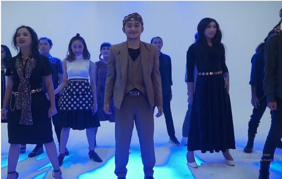
Gambar 8. Adegan Ending dari Pertunjukan Teater Musikal “Kabayan Metropolitan”

Sebuah ide kreatif menjadi suatu bentuk pertunjukan teater musikal berdasarkan