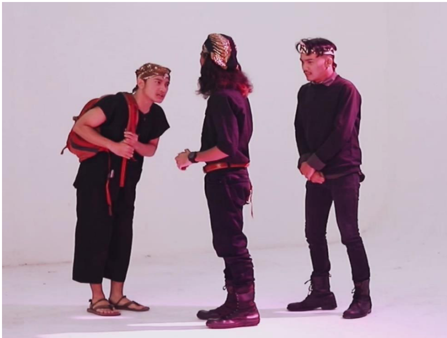
Gambar 5. Ciri latar adat dan budaya masing- masing aktor dari ikat dan blangkon

Nilai kebudayaan dari pertunjukan ini, berlatar di tatar Sunda, sebelum Iteung merantau ke Jakarta. Adat Sunda yang sangat kental dengan nilai kesopanan dan kepatuhan dalam roman ini menjadi nilai budaya yang bisa di kemas dalam bentuk rekayasa budaya. Dimana bahwa jaman sekarang, adat istiadat hampir tak dipandang sebagai pedoman kehidupan bangsa kita.