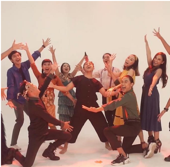
Gambar 4. Para aktor teater musikal “Kabayan Metropolitan”

Si Kabayan selalu menjadi subjek cerita. Bahkan pada banyak cerita, Si Kabayan seringkali menjadi super hero. Segi lain yang tidak dimiliki oleh kedua tokoh tersebut adalah kepopulerannya dalam teks-teks lain selain dalam sastra lisan. Dengan kata lain, Si Kabayan atau Cerita Si Kabayan mengalami transformasi yang luar biasa. Kuatnya transformasi cerita Si Kabayan, bukan hanya melampaui dua cerita tadi, pantun dan wayang golek, tetapi melampaui cerita-cerita jenaka lainnya di Nusantara. Cerita Si Kabayan mengalami transformasi tidak hanya ke dalam bentuk sastra tulis, tetapi juga kembali kelisanan tahap kedua, meminjam istilah Walter J. Ong (1982). Artinya, cerita Si Kabayan mengalami pula transformasi ke dalam teks lisan yang berdasarkan teks tulis. Ia mengalami pula transformasi ke dalam bentuk drama dan film.