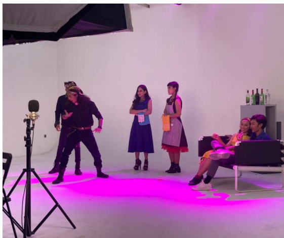
Gambar 1. Proses Shooting “Kabayan Metropolitan” (Sumber: Kala Project, 20 November 2021)

Pertunjukan teater musik ‘Kabayan Metropolitan’ menceritakan kehidupan Kabayan dan Iteung yang di adaptasi