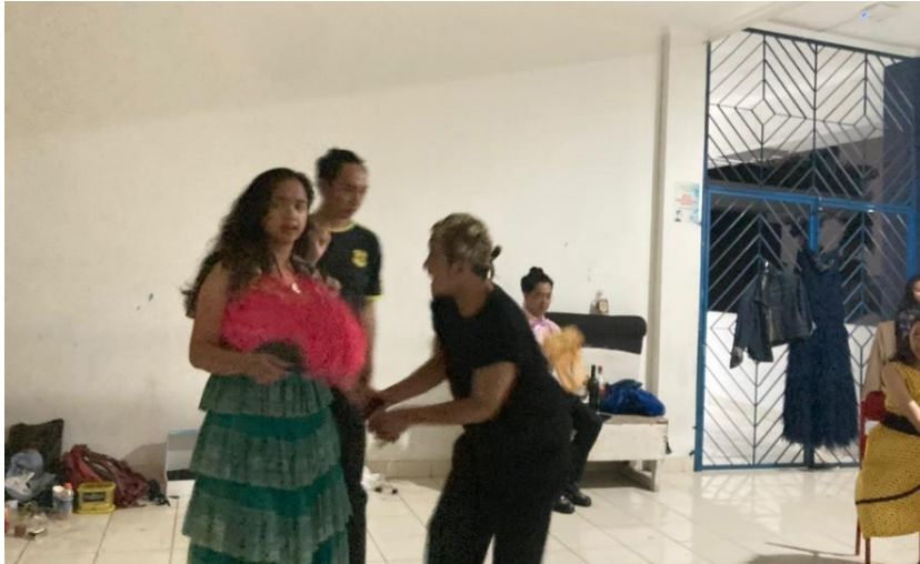
Gambar 8. Proses Latihan Teater Musikal “Kabayan Metropolitan”