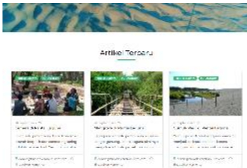
Gambar 3. WEB KIM Lemburpurwo

Website KIM berisi informasi desa dalam bentuk Foto disertai Artikel terkait informasi Desa Lemburpurwo dan potensi-potensi desa telah di pulish melalui Web KIM Lebupurwo yang dapat di akses melalui link berikut https://bumdeslembupurwo.com/