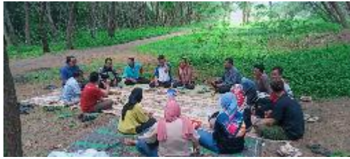
Gambar 2. FGD Tatakelola BUMDES

Kegiatan FGD kedua ini berfokuskan pada diskusi terkait tata kelola BUMDES. Dari hasil kegiatan FGD kedua ini kelompok informasi masyarakat berada dibawah BUMDES. Serah terima website KIM BUMDES Lemburpurwo dilaksanakan sekaligus pada FGD kedua web informasi dikelola oleh KIM BUMDES Lemburpurwo.