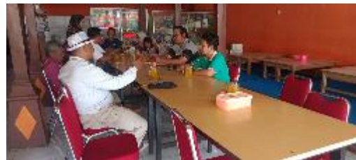
Gambar 1. FGD Kesiapan Sistem Informasi

Kegiatan diawali melalui FGD pertama yang dilakukan dengan fokus diskusi terkait kebutuhan Sistem Informasi. FGD dilakukan di salahsatu rumah makan desa Lembupurwo dengan melibatkan tim pelaksana pengabdian bersama Mitra Desa perangkat desa, Pengawas BUMDES dan tim BUMDES Lebupurwo. Dengan menghadirkan pakar atau tenaga ahli dalam bidang Sistem Informasi.