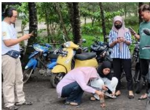
Gambar 4. Pelatihan Fotografi Tim BUMDES Lemburpurwo

Tahapan berikutnya adalah pelatihan fotografi.