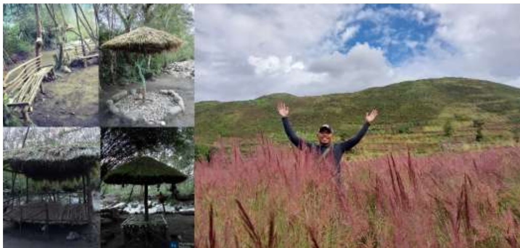
Gambar 2. Daya Tarik Rumput Mei berlatar Bebukitan dan Wisata Suarek

Kampung Tulima merupakan salah satu kampung di provinsi Papua Pegunungan yang terletak di Distrik Welesi Kabupaten Jayawijaya. Untuk sampai ke Kampung Tulima, dibutuhkan perjalanan dengan jarak tempuh \pm 8 kilometer dari ibu kota kabupaten. Kampung Tulima memiliki daya tarik wisata berupa pemandangan perbukitan, taman wisata suarek yang berbasis kearifan lokal, sungai yang masih alami. Adapun wisata suarek adalah taman wisata yang didalamnya terdapat kearifan lokal arsitektur tradisional yang didesain sebagaimana bangunan honai khas Papua, yang beratapkan alang-alang. Hal ini tentu saja selaras dengan pendapat Wahyudin et al. (2021), bahwa arsitektur tradisional yang berbalut kearifan lokal, mencerminkan keaslian suatu wilayah/daerah yang dapat dikembangkan menjadi daya tarik wisata. Selain itu, pada waktu-waktu tertentu, terdapat fenomena rumput mei, yakni mekarnya rumput mei, yang hanya terdapat di beberapa daerah di Papua, salah satunya di Wamena. Di Kampung Tulima, fenomena mekarnya rumput mei yang hanya terjadi sekali dalam setahun, dapat disaksikan, dengan latar bukit-bukit yang turut menambah keindahan alam di Kampung Tulima.