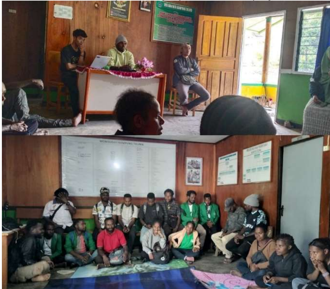
Gambar 6. Evaluasi perkembangan pariwisata di Kampung Tulima

Evaluasi ini diharapkan dapat menjadi pendorong semangat kepada masyarakat agar dapat mengembangkan potensi-potensi wisata yang ada di kampungnya agar dapat bermanfaat bagi masyarakat. Di daerah-daerah dimana keberadaan sumber daya lokal, warisan budaya dan budaya memberikan kemungkinan bagi pengembangan pariwisata yang dapat berkontribusi terhadap penciptaan lapangan kerja dan peningkatan standar hidup masyarakat kecil pedesaan (Terzić et al., 2020).