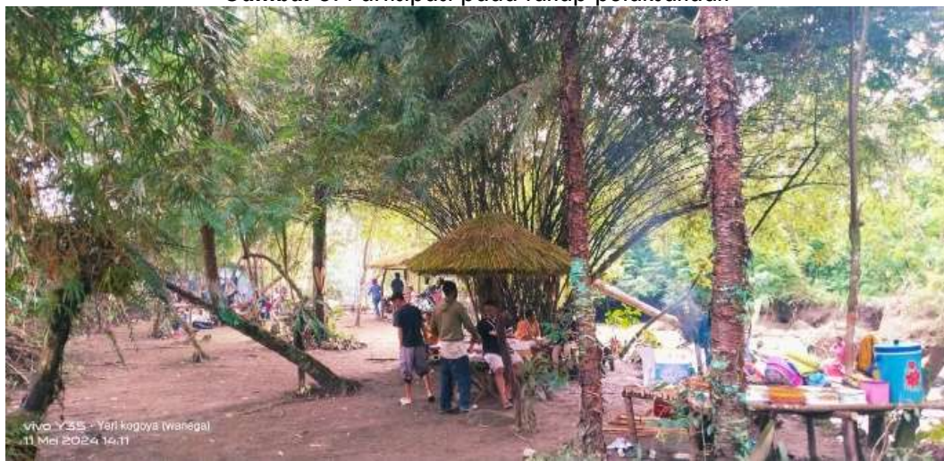
Gambar 5. Partisipasi pada tahap pelaksanaan

Keterlibatan dalam tahapan ini sebagian besar adalah mereka yang terkait langsung dengan pengembangan kawasan yang menjadi daya tarik wisata di Kampung Tulima yakni Taman Wisata Suarek . Taman Wisata Suarek adalah wilayah yang berada di dalam Kampung Tulima, yang berdekatan dengan Kantor Kampung. Taman Wisata Suarek berisikan tempat-tempat yang didesain dengan arsitektur tradisional Papua (misalnya: atap bangunan yang menggunakan jerami, sebagaimana yang digunakan dalam rumah honai ), dengan memanfaatkan alam sebagai bahan baku bangunan. Tingkat partisipasi masyarakat dalam tahap pelaksanaan pengembangan Kawasan yang menjadi daya tarik mahasiswa di Kampung Tulima, dapat dikatakan baik dan optimal.