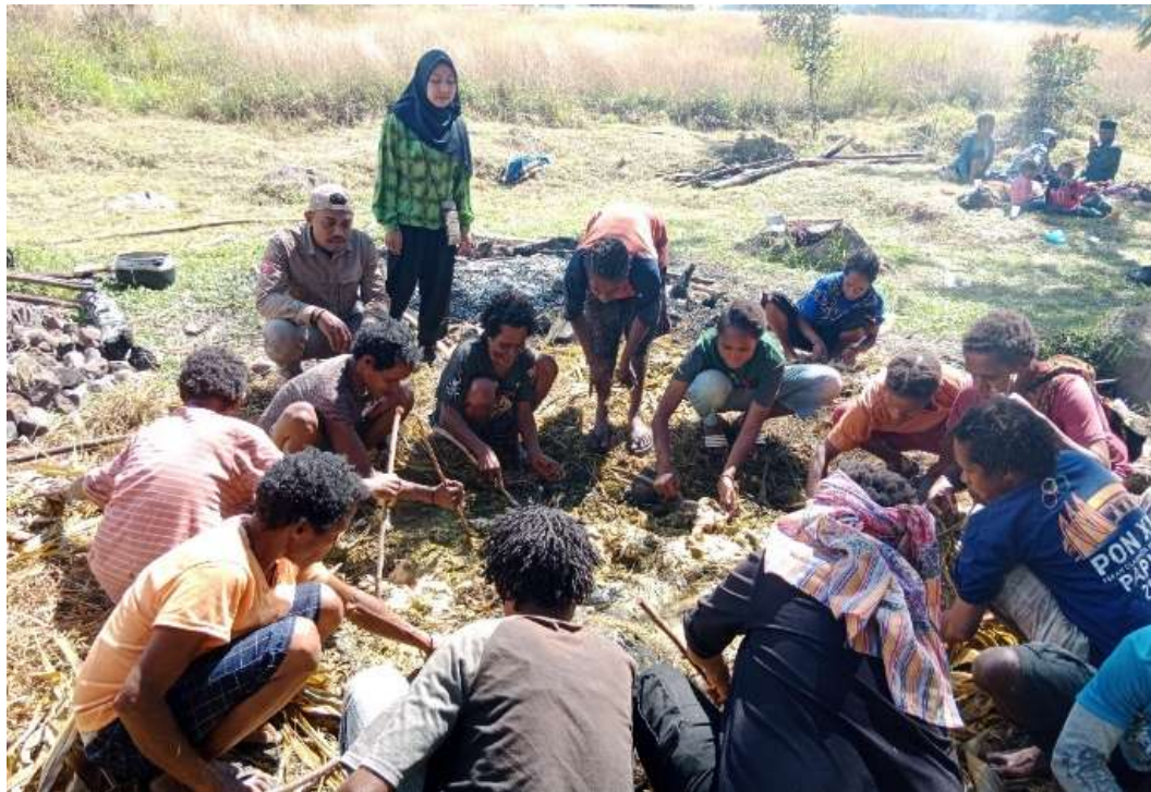
Gambar 3. Aktivitas Bakar Batu di Kampung Tulima

Hal ini juga mendukung peraturan pemerintah dalam program prioritas Undang-Undang Nomor 6 Tahun 2014 tentang Desa. Dimana dijelaskan bahwa desa mempunyai hak asal usul dan hak tradisional dalam mengatur dan mengurus kepentingan masyarakat setempat serta berperan dalam mewujudkan cita-cita kemerdekaan berdasarkan Undang-Undang Dasar Negara Republik Indonesia Tahun 1945. Hal ini juga mengacu pada potensi pendukung yang ada di lingkungan desa seperti keberadaan masyarakat lokal, kearifan lokal, tumbuhnya sektor ekonomi penduduk lokal dan pembangunan berkelanjutan (Farel et al., 2023).