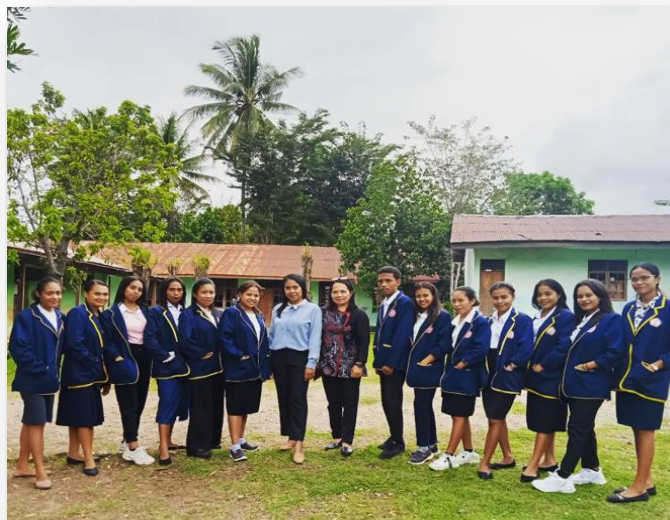
Gambar 4. Foto Bersama Peserta Pelatihan