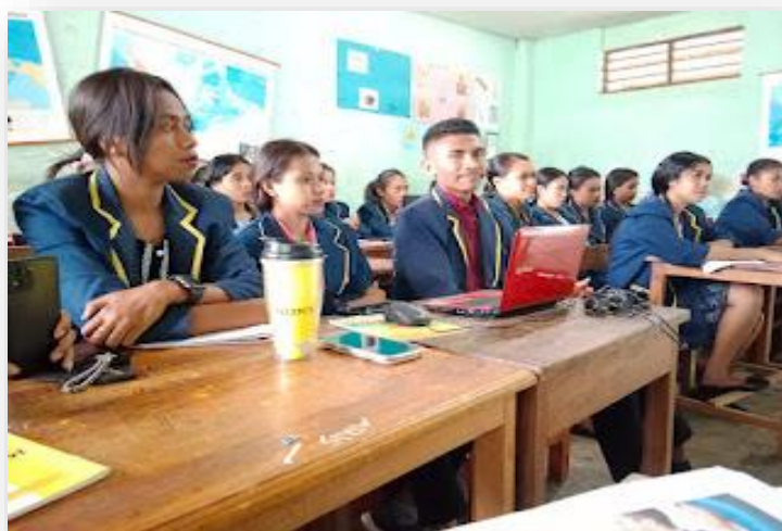
Gambar 2. Peserta Pelatihan

Kegiatan pelatihan ini telah dilaksanakan di kampus STKIP Surya Kasih Kefamenanu pada tanggal 18 April 2023. Peserta kegiatan sebanyak 16 orang yang merupakan mahasiswa Program Studi PGSD STKIP Surya Kasih. Antusiasme mahasiswa sebagai calon guru tinggi karena diberikan pengetahuan baru yang dapat mendukung aktivitas pembelajaran di kelas.