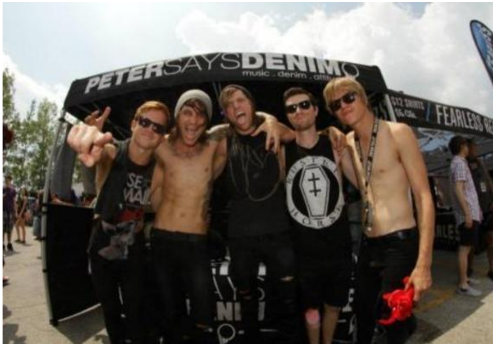
Gambar 3 Sampel 3: Band Bless The Fall

terlepas dari itu sampel ini cukup membuktikan bahwa upaya promosi ini pernah dilakukan oleh PSD.