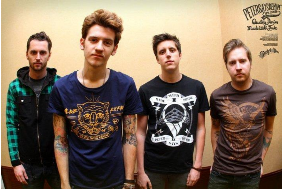
Gambar 1 Sampel 1: Band A Rocket to The Moon (sumber: http://lonrsm.co.vu/post/7010394315 , diakses 16 Maret 2019)

Dalam studi analisis ini, penulis mengambil 3 (tiga) sampel visual dari PSD, dan beberapa sampel yang diambil dari akun Instagram PSD yang sekarang menjadi salah satu kanal komersial PSD. 2 sampel pertama diambil dari akun facebook dari PSD dan 1 sampel terakhir didapat dari tumblr.com , sampel terakhir merupakan artefak promosi yang