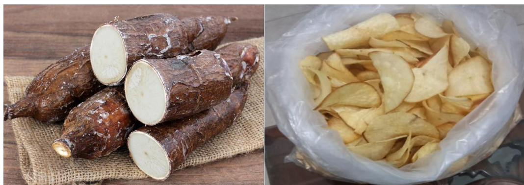
Gambar 1. Sebagian Singkong yang akan di kupas dan Keripik yang dihasilkan

1). Tahap persiapan Bahan Baku, pada tahap ini meliputi kegiatan pembersihan, pengupasan kulit dan pencucian.