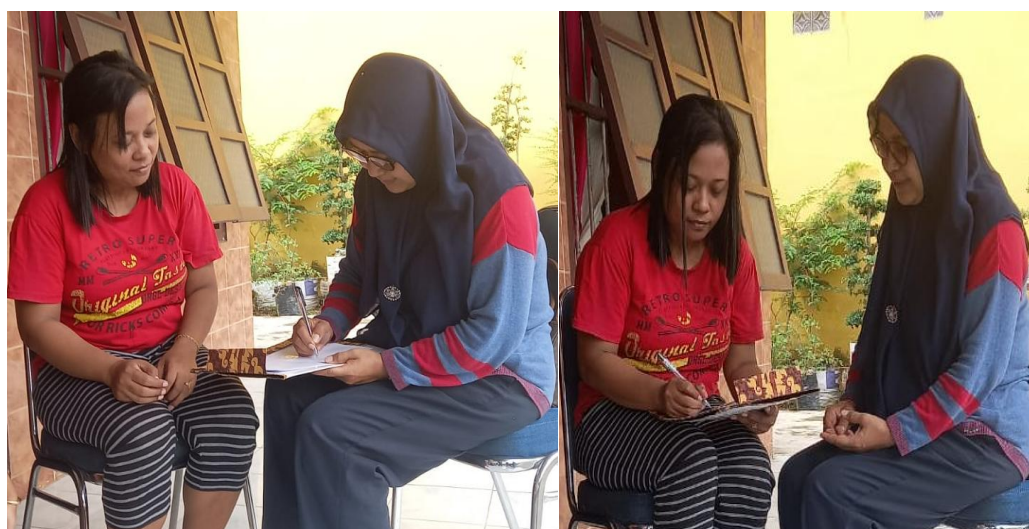
Gambar 2. Wawancara Ketua pengusul dengan mitra dan tanda tangan surat pernyataan

Menurut mitra dalam survey yang dilakukan pada tanggal 12 mei 2024, bahwa tingkat keseragaman (tebal tipisnya) irisan menentukan kualitas keripik yang dihasilkan. Dari wawancara tersebut diketahui bahwa harga bahan baku singkong Rp 3000/kg. Untuk pembelian bahan baku (singkong) sebanyak 20 kg butuh biaya Rp 60.000/hari. Biaya modal yang lain seperti: minyak goreng sebanyak 2 kg, bumbu, plastik kemasan, gas LPG kapasitas 3 kg dan biaya untuk transport belanja bahan, bersama biaya bahan baku singkong, semuanya mencapai Rp 115.000.