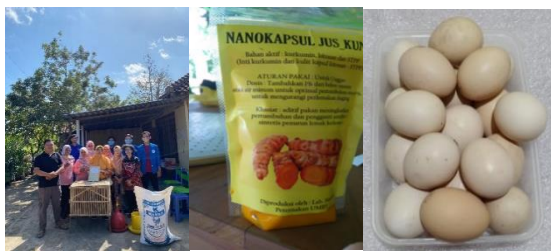
Gambar 2. a. Foto bersama Tim Pengabdian dan Mitra pada acara Penyerahan induk Ayam (Babonisasi), b. Produk NK, dan c. telur ayam kampung.

bertelur dan berkembang biak, untuk siap digulirkan lagi. (Kendalanya ayam KUB sudah berkurang sifat mengeramnya, sehingga untuk program kedepannya pelatihan penetasan dengan mesin tetas).