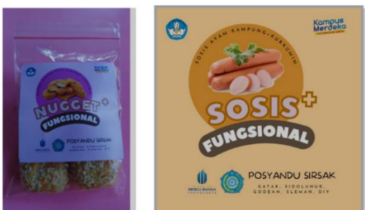
Gambar 3. Nugget dan Sosis fungsional daging ayam kampung sebagai pmt pada posyandu.