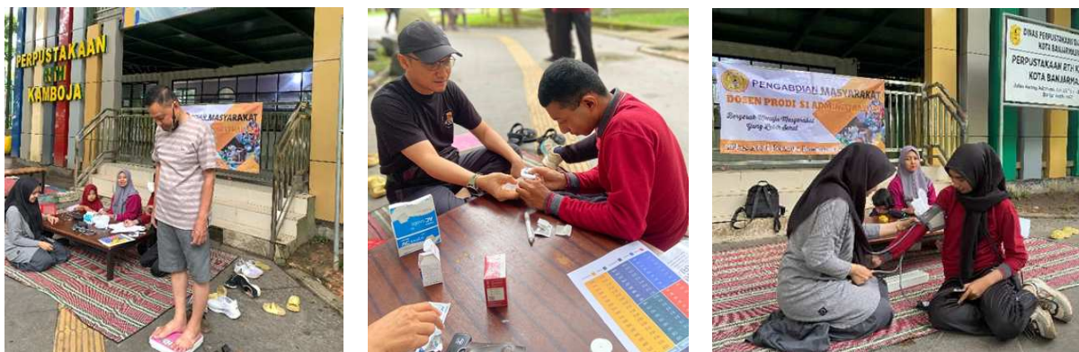
Gambar 1. Pemeriksaan Medical Chek-up Dasar Peserta Kegiatan

Selain faktor pengguna, keterbatasan sistem aplikasi juga menjadi kemungkinan penyebab data tidak valid. Aplikasi SIPGAR menggunakan algoritma tertentu dengan ambang batas fisiologis yang telah ditetapkan sebelumnya. Data peserta yang berada di luar rentang normal sistem secara otomatis tidak dapat diproses secara optimal. Faktor teknis lain seperti akurasi sensor smartphone, kestabilan GPS, perbedaan spesifikasi perangkat, serta inkonsistensi tempo berjalan peserta selama tes berlangsung juga berpotensi memengaruhi validitas hasil pengukuran. Temuan ini menunjukkan bahwa implementasi teknologi kesehatan digital tidak hanya bergantung pada validitas metode pengukuran, tetapi juga dipengaruhi oleh kesiapan pengguna dan kualitas perangkat teknologi yang digunakan. Oleh karena itu, diperlukan optimalisasi pengembangan aplikasi SIPGAR melalui penyederhanaan antarmuka pengguna (user interface), peningkatan fitur edukasi penggunaan aplikasi, serta penyempurnaan algoritma validasi data agar lebih adaptif terhadap kondisi lapangan masyarakat umum. Dengan demikian, penggunaan aplikasi SIPGAR di masa mendatang dapat menjadi lebih efektif, akurat, dan berkelanjutan sebagai instrumen monitoring kebugaran masyarakat berbasis digital.