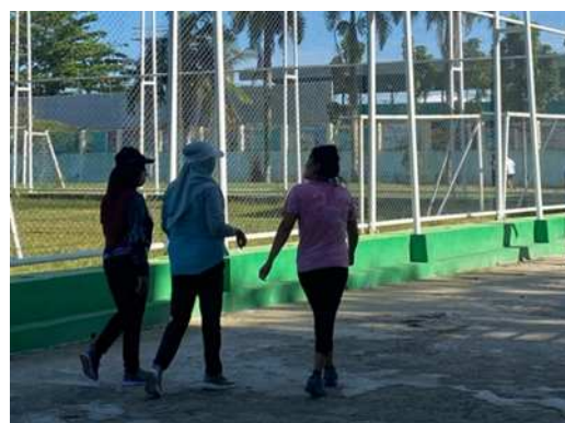
Gambar 2. Metode Rockport Fitness Walking Test jarak tempuh 1,6 kilometer (1 mil)