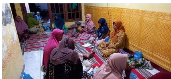
Gambar 3. Diskusi Interaktif Bersama Jama'ah Perempuan di Rumah Jama'ah

Sarasehan terbuka yang dihadiri lebih dari 100 masyarakat memperlihatkan dinamika diskusi yang hidup. Peserta tidak hanya mendengarkan, tetapi juga aktif bertanya tentang berbagai mitos terkait konsumsi air. Pertanyaan seperti “Apakah minum air dalam jumlah besar saat berbuka puasa itu sehat?” memperlihatkan adanya kesenjangan informasi yang signifikan di masyarakat. Setelah diberikan penjelasan berbasis sains, sebagian besar masyarakat menyatakan kesediaannya untuk lebih bijak dalam mengatur pola minum harian. Diskusi ini juga memperlihatkan bahwa banyak masyarakat sebenarnya memiliki rasa ingin tahu yang tinggi, hanya saja belum menemukan forum edukasi yang tepat. Interaksi langsung dengan narasumber membantu menjembatani kesalahpahaman yang ada, sekaligus memperkuat pemahaman dengan contoh kasus sehari-hari. Dengan demikian, forum diskusi menjadi sarana penting untuk meluruskan mitos dan membangun literasi kesehatan berbasis bukti ilmiah.[6], [14]