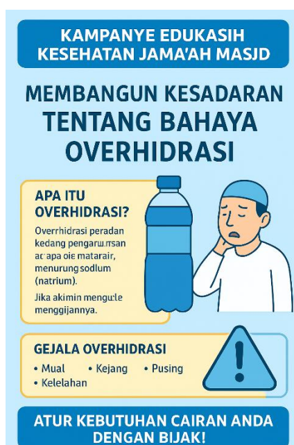
Gambar 4. Poster kampanye

lingkungan masjid, melainkan menjangkau rumah tangga Masyarakat. Lebih lanjut, beberapa masyarakat membagikan ulang informasi dari poster dan leaflet melalui akun media sosial pribadi mereka, memperluas dampak kampanye ke jaringan yang lebih luas. Peran remaja masjid sangat signifikan karena mereka membantu merancang konten edukasi berbasis digital berupa video pendek dan infografis. Konten ini mendapat banyak respons positif, khususnya dari kalangan muda yang lebih akrab dengan teknologi. Kolaborasi lintas generasi ini membuktikan bahwa edukasi kesehatan dapat lebih efektif bila dikomunikasikan dengan medium yang sesuai dengan segmen audiens.[9], [10]