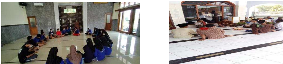
Gambar 2. Penyuluhan Interaktif Kepada Takmir Masjid dan Remas

disampaikan secara komunikatif, dapat menghasilkan perubahan nyata dalam perilaku sehari-hari. Penyuluhan menjadi bukti bahwa masjid dapat menjadi ruang edukasi efektif untuk menyampaikan pesan kesehatan yang selama ini jarang diperhatikan masyarakat.[1], [13]