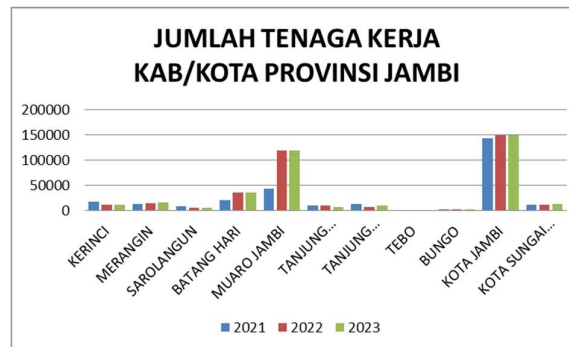
Gambar 3 Grafik Tenaga Kerja Provinsi Jambi Sumber: Data Sekunder BPS Provinsi Jambi 2021-2023