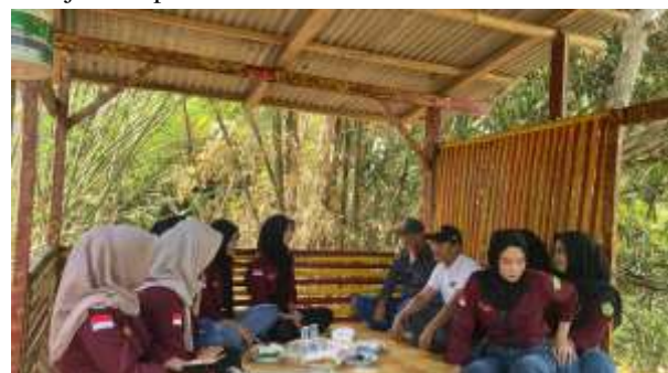
Gambar 2 Tim melakukan diskusi dengan pemilik UMKM Kopi

Langkah pertama yang dilakukan adalah Melakukan pemilihan barang yang akan diperjualbelikan dalam kegiatan tersebut yang berhubungan dengan produk kopi, seperti biji kopi pilihan, bubuk kopi berkualitas, atau aksesoris pendukung lainnya. Selain itu, dilakukan juga pemilihan nama yang unik dan menarik untuk merepresentasikan produk, desain logo yang mencerminkan identitas merek, serta penentuan harga yang kompetitif dan sesuai dengan target pasar. Semua elemen tersebut akan dijadikan pelengkap pada kotak lilin agar memberikan nilai tambah dan menciptakan kesan eksklusif bagi konsumen. Proses ini melibatkan riset pasar untuk memastikan produk yang dipilih relevan dan diminati oleh calon pembeli. Proses diskusi dalam melakukan pemilihan produk yang akan diperjualbelikan ditunjukkan pada Gambar 2.