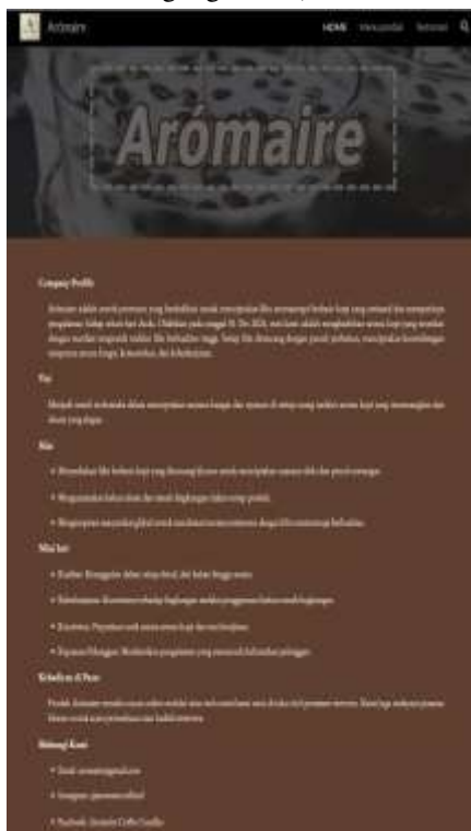
Gambar 3 Tampilan depan Website

Langkah kedua yang dilakukan adalah melakukan perancangan website yang diawali dengan dengan penentuan target pengunjung. UMKM pada kegiatan Expo memiliki produk ‘lilin kopi aromaterapi’. Selain itu, produk ini memiliki banyak ukuran pada lilin kopi aromaterapi dan memiliki harga yang beragam. Dalam hal ini, pemilik UMKM menargetkan pengunjung berasal dari remaja yang menyukai suatu karya seni yang unik dan estetik. Apabila mengacu pada perspektif gender, target konsumen adalah perempuan yang memiliki standar kesenian yang tinggi. Selain itu, konsumen yang membeli lilin kopi aromaterapi berasal dari remaja yang memiliki kebiasaan tidur yang ingin tenang dan nyaman namun tetap bikin rileks. Berdasarkan analisis situasi tersebut, pemilik UMKM merasa perlu untuk membuat website yang mobile friendly agar memberikan rasa nyaman kepada pengunjung. Tim mahasiswa mempersiapkan konten-konten informatif agar memberikan manfaat kepada pengunjung. Langkah selanjutnya adalah tim mendesain tampilan website melalui google sites yang menarik. Tim mahasiswa mendesain agar komposisi gambar dan pemilihan warna memenuhi unsur estetika. Selain itu, tim merancang agar website bersifat ergonomis, yaitu memiliki ukuran font yang tepat, serta mengatur tombol navigasi yang mudah dan cepat diakses. (masukin alamat web google sites)