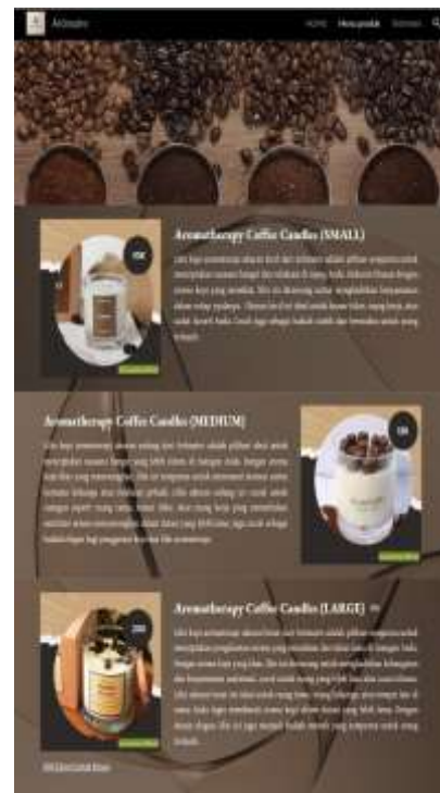
Gambar 4 Tampilan Menu Produk

Gambar 3 menunjukkan tampilan depan website yang memuat informasi mengenai pengenalan produk, yaitu berupa company profile, visi misi, nilai inti, kehadiran di pasar, dan kontak. Selain itu, UMKM menyediakan jasa layanan pesan antar untuk memudahkan konsumen dalam memperoleh produk yang dipesan. Website juga menampilkan tiga kategori produk yang dijual, yaitu Aromatherapy Coffee Candles (small), Aromatherapy Coffee Candles (medium), dan Aromatherapy Coffee Candles (large) yang disajikan pada Gambar 4