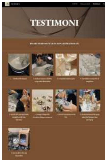
Gambar 6 Proses pembuatan Produk

Adapun tampilan untuk informasi lokasi tempat usaha/maps ditunjukkan pada Gambar 5. Selain itu, website menampilkan informasi harga produk sehingga memudahkan pengunjung dalam melakukan keputusan pembelian. Kemudian, website juga memberikan kemudahan bagi pengunjung untuk melihat proses pembuatan produk kita by handmade yang disajikan pada Gambar 6. Gambar 6 menunjukkan bahwa produk yang dihasilkan berdasarkan karya seni dari mahasiswa Expo Manajemen Universitas Malahayati. Hal ini bertujuan untuk menarik pelanggan dan memberikan kepercayaan yang kuat terhadap produk yang dihasilkan. Setelah melakukan perancangan website, tim mahasiswa melakukan laporan kepada dosen untuk dikaji ulang