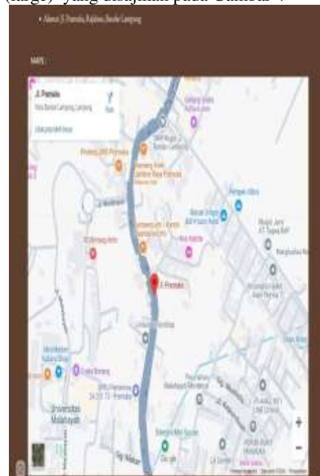
Gambar 5 Maps/Lokasi tempat usaha

Gambar 3 menunjukkan tampilan depan website yang memuat informasi mengenai pengenalan produk, yaitu berupa company profile, visi misi, nilai inti, kehadiran di pasar, dan kontak. Selain itu, UMKM menyediakan jasa layanan pesan antar untuk memudahkan konsumen dalam memperoleh produk yang dipesan. Website juga menampilkan tiga kategori produk yang dijual, yaitu Aromatherapy Coffee Candles (small), Aromatherapy Coffee Candles (medium), dan Aromatherapy Coffee Candles (large) yang disajikan pada Gambar 4