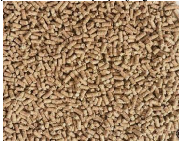
Gambar 1. Pelet

Pesatnya perkembangan teknologi akhir-akhir ini menuntut tenaga ahli untuk menciptakan inovasi atau produk mutakhir yang dapat mengubah peradaban manusia agar lebih efisien dalam waktu, tenaga dan biaya yang dikeluarkan (Pristiansyah, dkk, 2022). Untuk membantu mengatasi masalah tersebut yaitu dengan membuat mesin teknologi tepat guna (Pristiansyah, dkk, 2021), maka dalam penelitian ini bagaimana proses pembuatan mesin pencetak paka ayam dam bagaimna alat pencetak apakan ayam bekerja dengan baik. Pelet adalah pakan berbentuk silinder yang bahan baku pakannya dicetak dengan menggunakan mesin sehingga menjadi bentuk silinder atau potongan kecil dengan diameter, panjang dan kekerasan yang berbeda (Ensminger et. Al, 1990). Pengolahan pakan berupa pelet dapat dijadikan pilihan karena memiliki beberapa keunggulan antara lain mempermudah dalam pemberian pakan dan nutrisi seimbang yang terkandung dalam komposisi pakan sehingga produktivitas ternak dapat optimal dan menurunkan biaya produksi. Pelet yang mempunyai kualitas baik adalah pelet yang memiliki ketahanan dan daya kekerasan yang baik, tidak mudah rusak saat penanganan dan pengangkutan, sehingga memiliki keunggulan mengurangi limbah pakan, meningkatkan konsumsi, dan efisiensi pakan, serta memperpanjang umur simpan (Dozier, 2001).