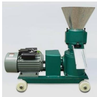
Gambar 2. Mesin Pencetak Pelet Listrik

Mesin ini menjadi penemuan mutakhir teknologi mesin pelet. Mesin ini digerakkan oleh tenaga listrik. Terdapat dinamo yang terkoneksi listrik rumahan dan berfungsi untuk menggerakkan screw. Keuntungan dari menggunakan mesin pelet ini ialah efisiensi waktu yang didapat dalam mengerjakan target saat memproduksi pakan ternak tersebut. Selain itu, berdampak pada tenaga kerja yang digunakan. Tidak perlu merekrut tenaga kerja terlalu banyak untuk mengolahnya. Yang dibutuhkan hanya operator mesin. Namun, upaya yang dikeluarkan untuk menggunakan mesin cukuplah besar, yaitu memastikan kapasitas tenaga listrik yang digunakan.